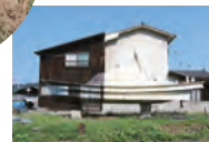
漁船のトリックアート