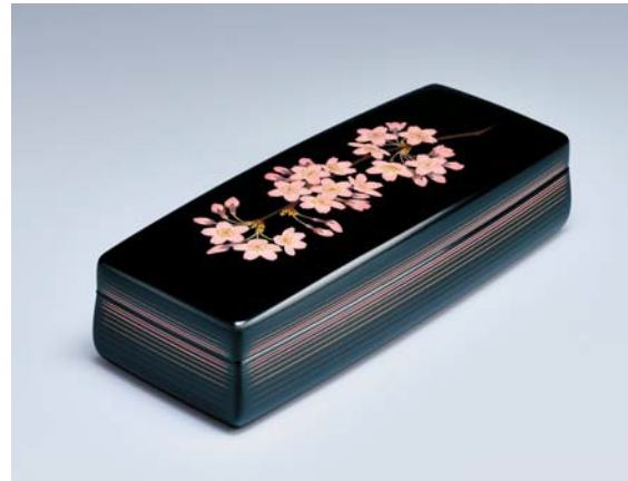
らんたいきんまぼこ 太田儔 藍胎蒔醬箱「さくら」