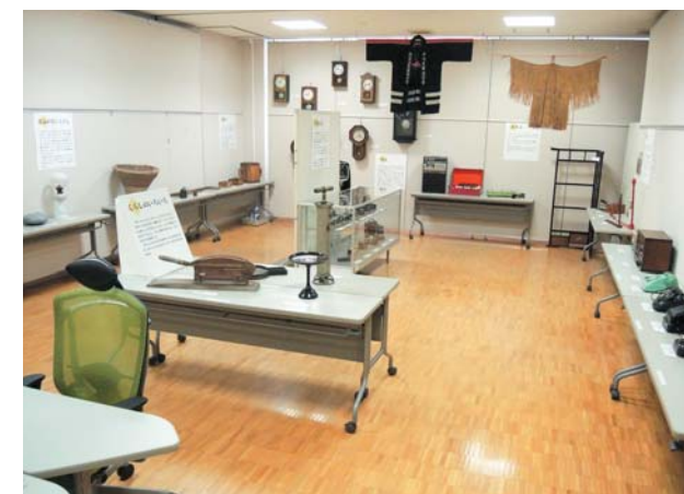
公民館での展示風景、集まった展示品はすべて地元からの出品