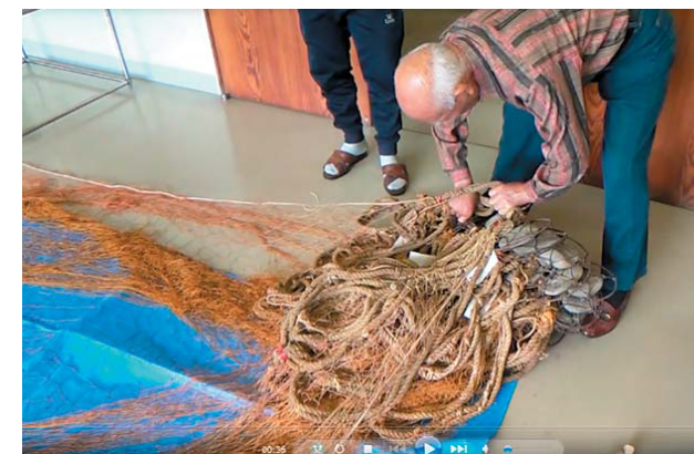
瀬戸内町の漁師による網の収納法の説明