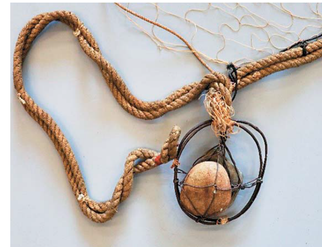
瀬戸内町のゴチ網の石のおもり

また、瀬戸内町で使用された底曳網の一種のゴチ網の調査では、同町の経験者に参加してもらいました。海底で網を滑りやすくするために、扁平な石のおもりを使用したことや、網を開きやすくするため船上での網の収納法を工夫したことについて説明を受け、これは当館での網の収納や展示に役立ちました。この活動の様子は、NHK高松放送局の「ゆう6かがわ」で放送されました。また同町では網に大漁の神が宿ると考え、これを神棚に祀る珍しい行事もありました。網は魚を捕るだけでなく、さまざまな意味を喚起する多面的な力があることが分かってきています。