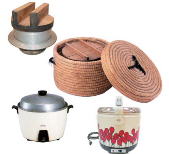
めしびつ めしぶこ 左上:羽釜 右上:飯櫃・飯釜 左下:電気炊飯器 以上、当館蔵 右下:電子ジャー 個人蔵

■ミュージアムトーク/1月25日(土)・2月8日(土)・2月22日(土) 各13:30～