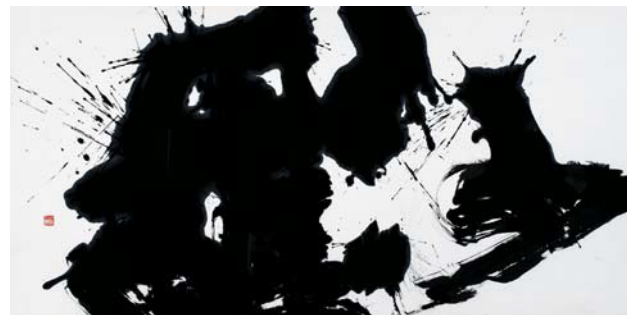
小森秀雲「沙羅」1989年 当館蔵