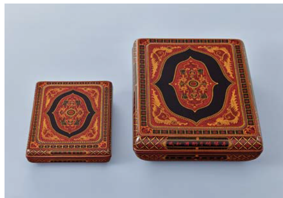
玉楮象谷「彩色蒔醬料紙箱及び硯箱」 嘉永7年(1854) 当館蔵