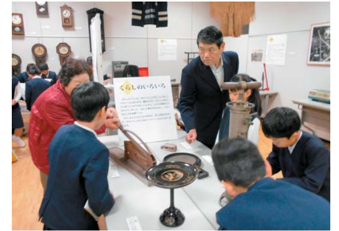
展示における出品者と地元小学生との交流

ります。東日本大震災、熊本地震、西日本豪雨など近年に限っても多くの自然災害が発生し、その中で文化遺産を救済する取り組みが行われています。これらの中で、救済前に廃棄されてしまうケースも多数報告されています。地域のあゆみは、その地域がもっているもので語られることに気付いてもらうことで、失われていくことを食い止めることにつなげられないかという発想が事業開始の原点にあります。