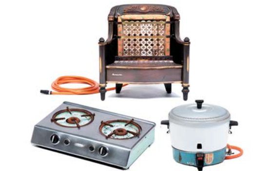
上:ガスストーブ 左:ガステーブル 右:ガス炊飯器 すべて当館蔵