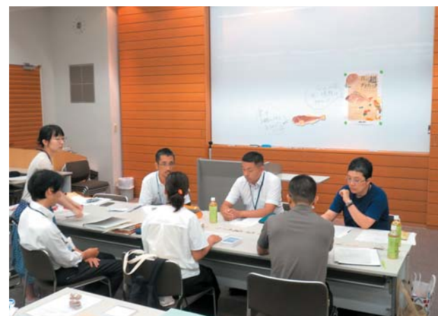
活用研での教材検討、試作品をもとに具体的な活動やその成果を考える