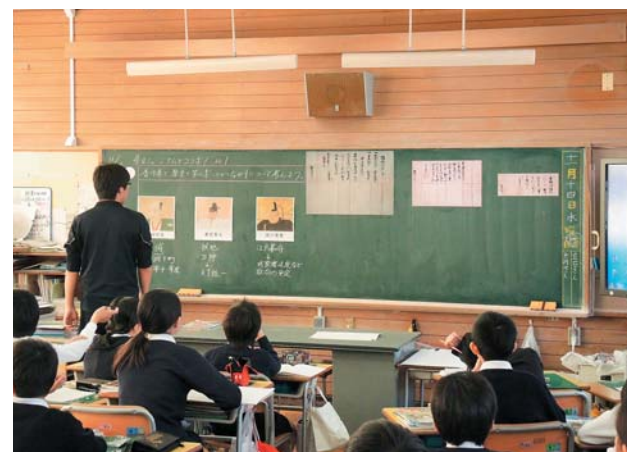
研究会での検討をもとに作成した試作教材を使った委員の先生による授業