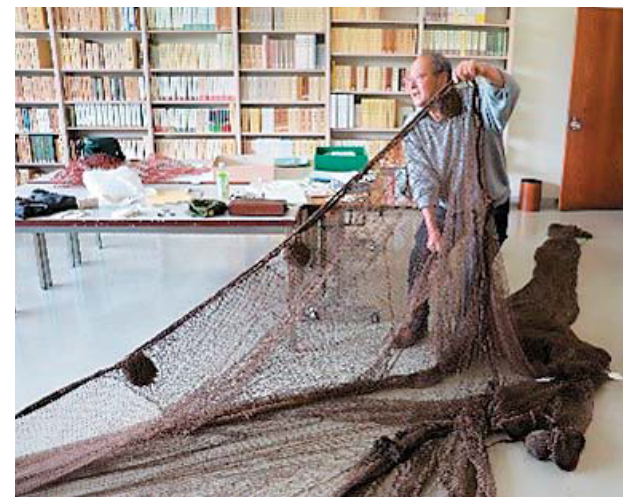
小田の打瀬網と底曳網漁師

瀬戸内海歴史民俗資料館は、瀬戸内海地域の漁撈用具を収集し、その内2843点が1977年に国の重要有形民俗文化財に指定され、翌1978年にはこれらの資料を裏付ける調査報告書を刊行しました。近年、瀬戸内国際芸術祭などで瀬戸内地域を訪れる人が急増、海の文化への関心が高まる中で、当館はこれらの資料を再整理・調査をし、海の文化に関する一層詳細な情報発信を行っています。