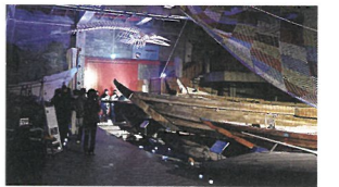
光と音の歴史解説ツアー