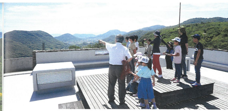
屋上展望台での学び（ふるさと体験ツアー）

そして、令和3年（2021）、第1展示室の中2階に瀬戸内ギャラリーを開設しました。瀬戸内、暮らし、自然などのテーマで、常設展示の内容とも呼応させながら総合的・分野横断的な展示を行うとともに、外部と連携して異なる分野の人たちが交わることで新たな化学反応が起きることを期待した取り組みです。開館50周年記念事業では、この空間を積極的に使いながら、さまざまな展示やイベントなどを行いました。