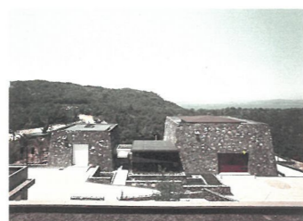
完成した漁撈収蔵庫（昭和55年）