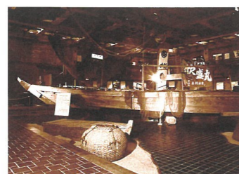
開館当初の第1展示室