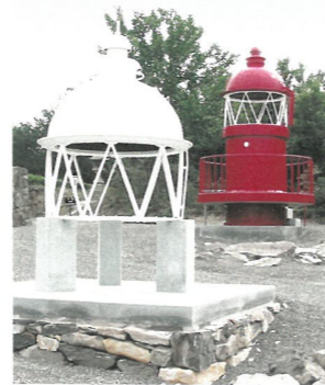
歴民の灯台（平成15年）30周年記念で旧高松港灯台を移設

平成11年（1999）に人文系総合博物館として香川県歴史博物館（現 香川県立ミュージアム）が開館すると、当館は瀬戸内の広域を対象とする民俗分野の専門館という位置付けになります。これによって3部門制は廃止され、「瀬戸内海の暮らしと文化」というテーマのもと、常設部分の展示替えが行われました。開館30周年を迎えたのは、ちょうどこの頃です。平成19年（2007）には香川県歴史博物館（翌年、香川県立ミュージアムに改称）の分館となります。この頃から、瀬戸内国際芸術祭の開始（2010年）などを機に瀬戸内の島々の歴史や暮らしなどへの関心が高まり、建築の人気とも重なって、若い世代の人たちの来館が徐々に増えてきました。