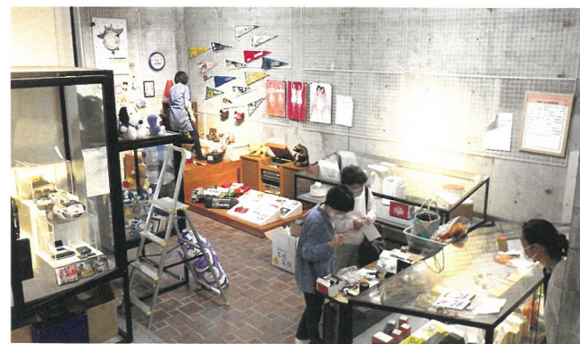
テーマ展作業風景

テーマ展「我が家の思い出モノ語り —モノ・コト・ヒトが紡ぐ50年—」は、この50年間の社会や暮らしの変化を身近な生活用具を通して見つめ直すことをコンセプトに、職員とともに1年間以上かけて準備してきたものです。ボランティアの皆さんの各家庭で使われてきたものを持ち寄り、モノにまつわる思い出を添えて展示を行いました。企画会議を重ね、手探りのなか完成した展示は、生活を豊かにした家電製品や夢中になって遊んだおもちゃ、お気に入りの衣服などが並び、楽しくちょっぴり甘酸っぱい思い出とともに社会の流行や家族との思い出をふり返るものとなりました。会期中には解説会も行い、来館者と話を弾ませました。