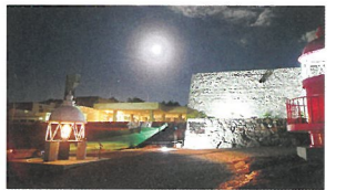
灯台が照らす夜の景観

夜の資料館で船舶灯などの展示を行ったほか、令和5年に寄贈された灯台フレネルレンズの点灯と屋上展望台での「夜の海」教室（高松海上保安部協力）、展示室を使った光と音の歴史解説ツアーや工作教室（香川大学創造工学部協力）、ウミホタル鑑賞会（香川県水産試験場協力）などを実施しました。