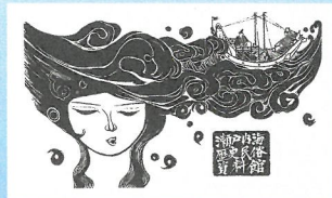
開館15周年記念ポスター (辻一摩氏デザイン)