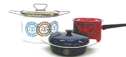
珐瑯鉄器 JETRO 収集海外優秀商品

また、昭和30～40年代にJETRO（日本貿易振興会）が収集した欧米の優秀商品のうち、現在の県産業技術センターに展示されていた資料が当館に収蔵されました。これらは、貿易拡大に向けて産業意匠を改善するために収集されたもので、香川県の産業デザインにも影響を与えた貴重な資料です。