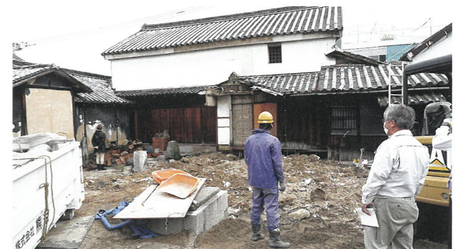
「家終い」に伴う資料収蔵調査