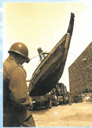
第1展示室に搬入される タイシバリアミ真網船 (全長15.2m)

「瀬戸内海及び周辺地域の漁撈用具」(2,843点)が国の重要有形民俗文化財に指定される