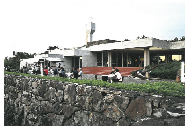
キッチンカーによる期間限定カフェで和む来館者（ライトアップれきみん）