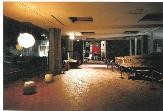
明かりに照らされた館内（ライトアップれきみん）

（一社）香川県建築士会高松支部青年部会との連携企画では、瀬戸内ギャラリー企画展「れきみんで建築を楽しもう」を開催し、館内スタンプラリーなども行って当館の建築的な見どころを紹介したほか、夕暮れから夜の建築の美しさを楽しむ「ライトアップれきみん」を開催しました。これらの企画では、専門家