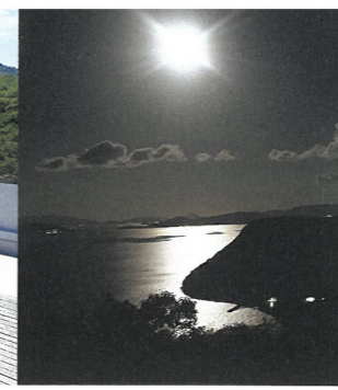
夜の瀬戸内海（ナイトミュージアム）