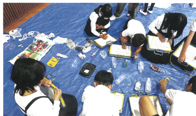
出前授業での海ごみ学習