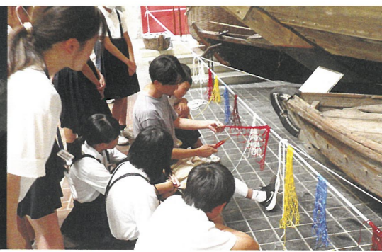
木造船の前で《そらあみ》を編む（そらあみ）