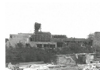
建設中の当館（昭和47年頃）

開館した当初、当館には歴史・民俗・考古の3部門があり、中でも民俗分野が充実しているのが特徴でした。国庫補助による調査事業等にも積極的に取り組み、昭和52年（1977）には「瀬戸内海及び周辺地域の漁撈用具」が重要有形民俗文化財に指定され、同55年に漁撈収蔵庫が完成します。また、平成5年（1993）には「瀬戸内海の船図及び船大工用具」が国指定となり、木造船製作現場の再現など常設展示の更新が行われます。開館25周年頃までは、県立の中核的な資料館として、3つの分野それぞれにおいて調査研究や資料収集、展示などの活動が行われていました。