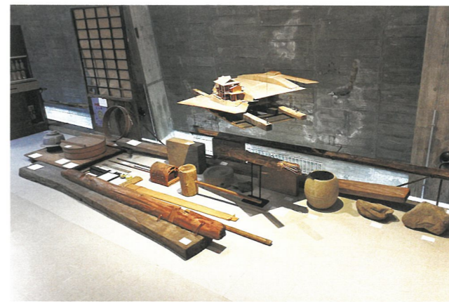
瀬戸内ギャラリー企画展「いにしよによる」(R4.10/1～12/18)

令和5年(2023)からは、地域の伝統文化・技術等の調査記録・発信事業を実施しています。少子高齢化・限界集落化の中、かつて当館が実施した島嶼部民俗調査や諸職調査、民俗芸能調査などの対象地域や職人、祭り・民俗芸能などの現況調査を実施するとともに、地域や保存団体の課題や工夫を共有し、今後の取り組みの参考になるよう、展示やトークイベントを実施していきます。