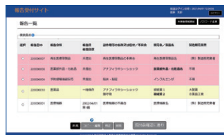
◀報告書登録済みの場合