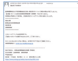
※実際の画面とは異なる場合があります

皆さまからの報告を起点に、厚生労働省、PMDA、製造販売業者など、医療にかかわる人たちが報告情報を活用することで、日本の医療を支えています。