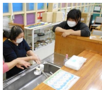
▲洗っても汚れが残しやすい場所を教してもらったあとに正しい手洗いの実践です