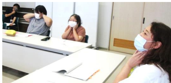
▲氷などで身体を冷やす場所は脈を打っているところ。自分の脈を確認中です。