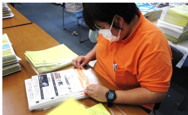
お仕事風景（封入業務）