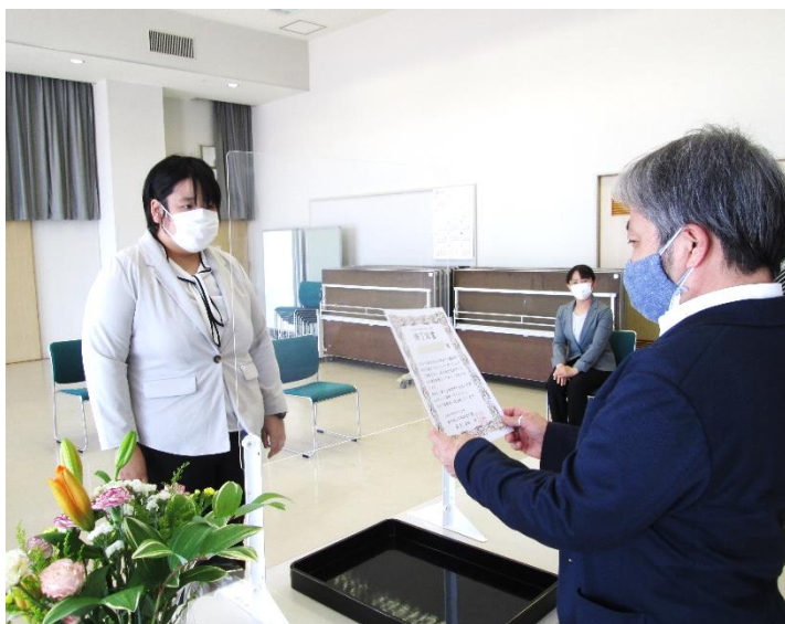
修了式にて園長より修了証書を受け取りました。

今年6月、トライアル雇用を経てYさんがめでたく就職されました。就労移行支援訓練中は失敗して落ち込んで、立ち止まることもあったYさん。修了式では、「失敗した時には落ち込むのではなく、次どうしたらいいかを考えて、次につなげていきます。そして、助けてもらった時には感謝を言葉で伝えていきます。」と決意の言葉がありました。修了式に来てくださったお母さんへ「いつも一緒にいて、毎日、いってらっしゃい、お帰りって迎えてくれたお母さん、本当にありがとうございました。」とお伝えしていました。就職先では、訓練やトライアル雇用での経験を活かし、発送業務や清掃業務などに積極的に取り組んでいます。就職先でのますますのご活躍を期待しています。