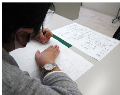
手本をじっくり見て、一文字ずつ心を込めて丁寧に書いていきます。

毎回、作品を制作しています。作品は、管理棟に展示していますので、是非ご覧ください。