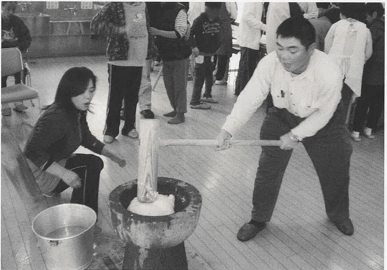
(年末もちつき風景)