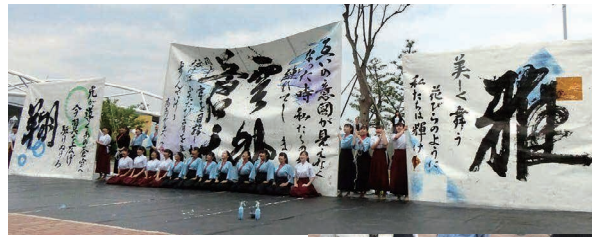
書道パフォーマンス & 書道体験

歓迎セレモニーや出港時の見送りアトラクションなどに加えて、香川らしさを感じられる交流やおもてなしを心がけている。