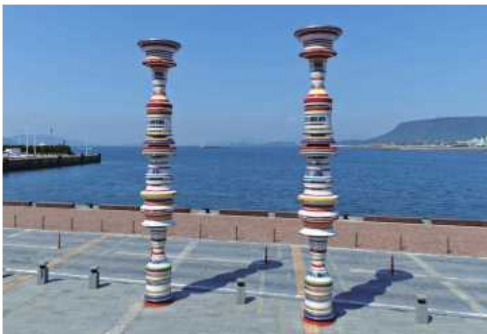
大巻伸嗣 Liminal Air -core-