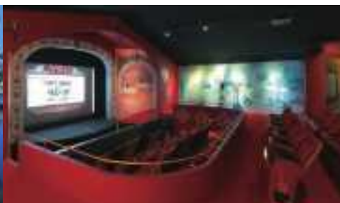
依田洋一郎 ISLAND THEATRE MEGI「女木島名画座」