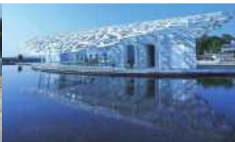
ジャウメ・ブレンサ 男木島の魂