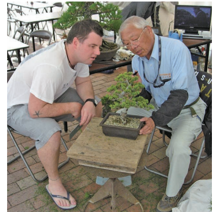
盆栽デモンストレーション