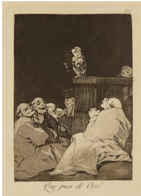
Que pivo de Oro!

権威ある専門家が集まった会議の結果を発表しています。あまりの愚策に言葉を失う。 しかし、民衆はことば巧みな演説に騙されて盲従する。