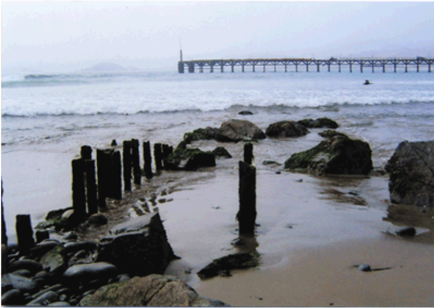
1899年に日本人移民が最初に上陸したセロ・アスール(ペルー)