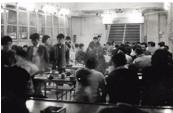
昭和40年頃 移住船さくら丸内の様子(食堂)