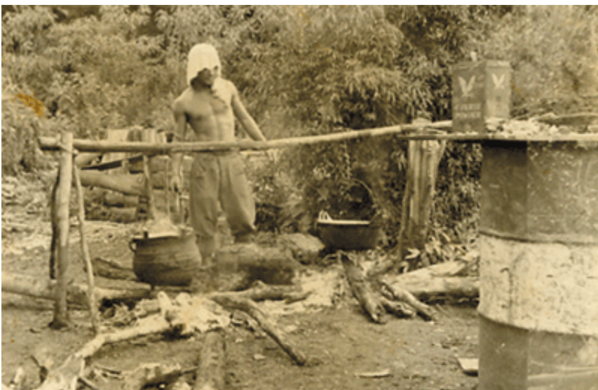
1957年(昭和32年) 豚油とり(チャベス移住地、パラグアイ)