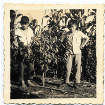
1962年(昭和37年) 2年目のコーヒー