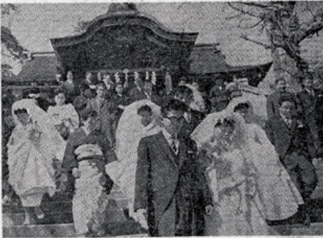
夢よくらむ「南の花嫁さん」(前日の納戸を飾る石浜尾八幡神社で)