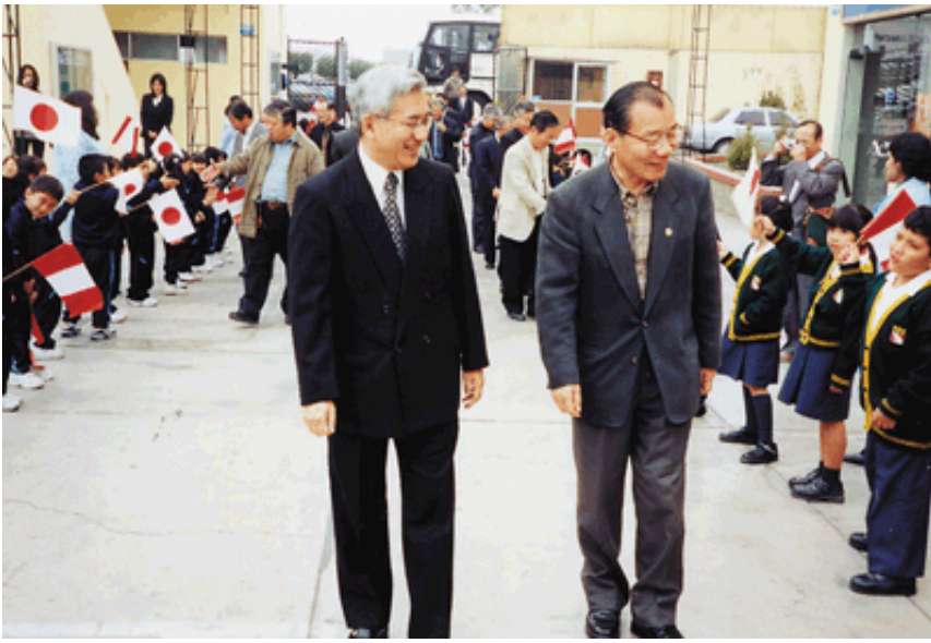
2003年(平成15年)6月 真鍋知事がペルーのラ・ウニオン総合学校を訪問