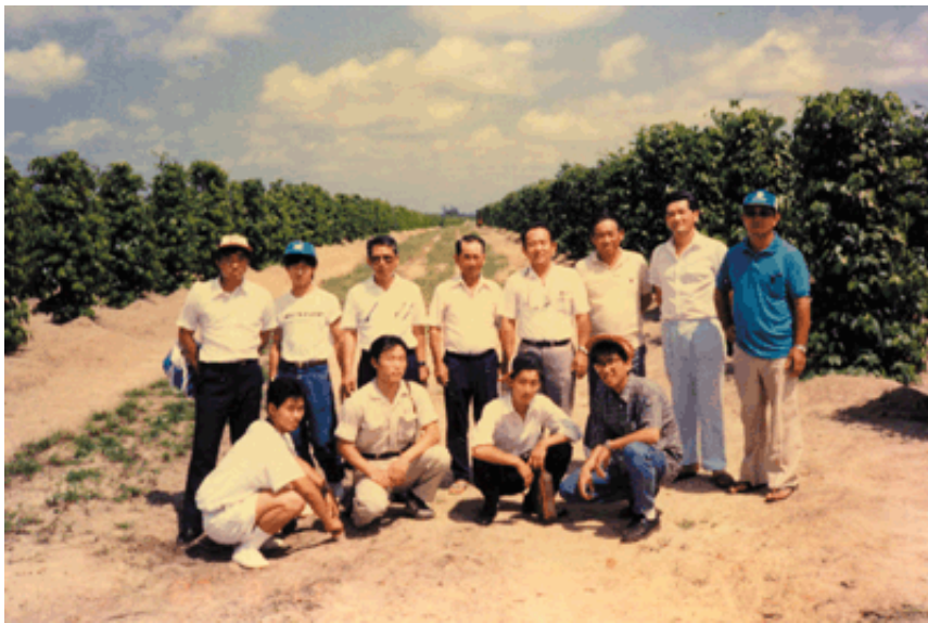
1987年(昭和62年) 第8回香川県ブラジル派遣研修事業(北伯)