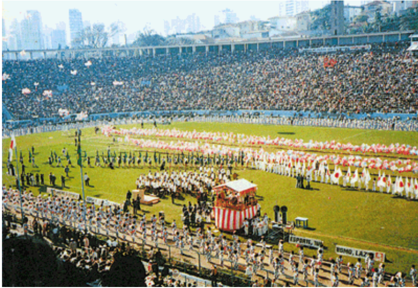
1978年(昭和53年)6月18日 ブラジル移住70周年記念式典 (サンパウロ・パカエンブー競技場)海外移住者だより 第15集より