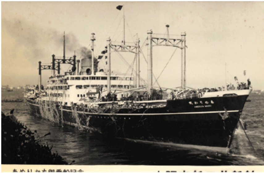
本船は丸太船の記念