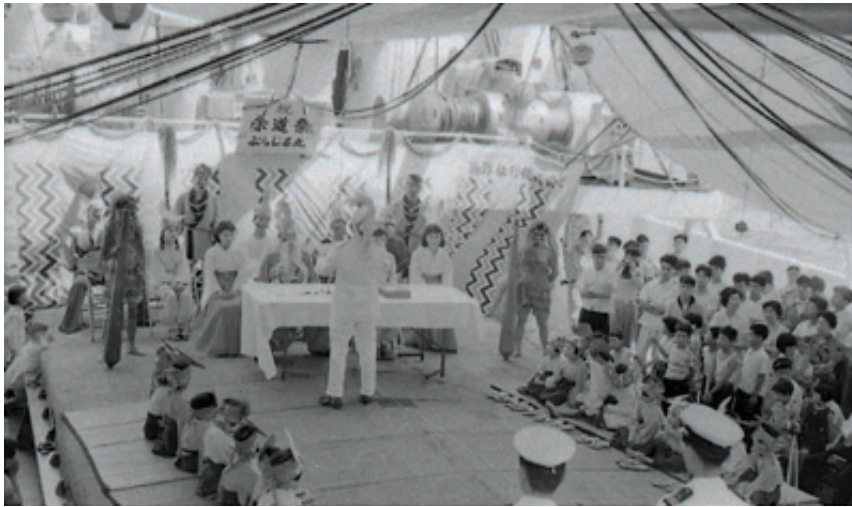
移住船内のレクリエーション