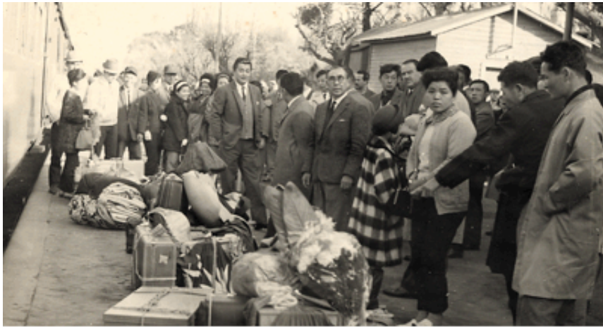
1964年(昭和39年) アルゼンチン アルベルアル・オエステ駅に着いた移住者達