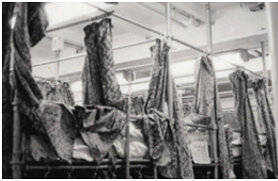
昭和40年頃 移住船さくら丸内の様子(寝台)