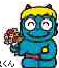
親切的な青鬼くん