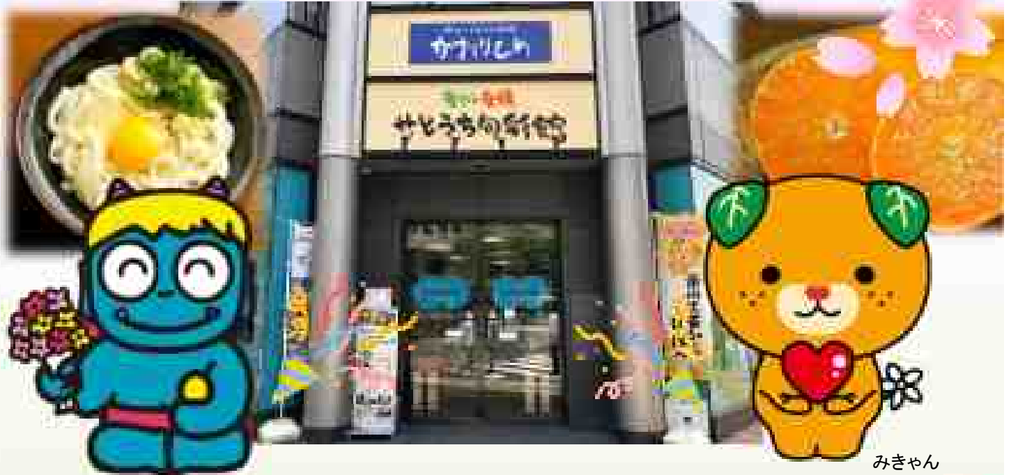
親切的な青鬼くん