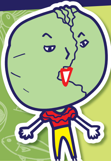
ビューティフル レタ子