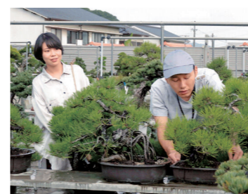
盆栽ラップソデー