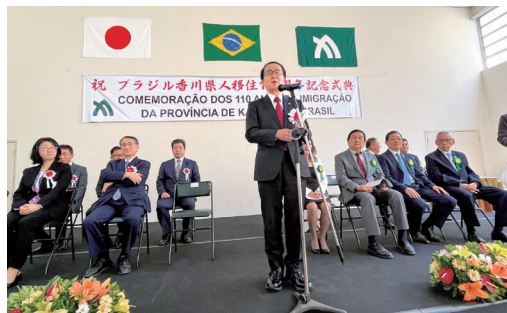
ブラジル香川県人移住110周年記念式典にて

パラグアイは、南米の内陸国で、物流の面で難があったのですが、あと5年以内に、チリからブラジルに向けての東西の高速道路が開通予定で、内陸のハンディキャップも解消されます。もともと人件費は安く、電力費も安く、治安も南米一良くて、水が豊富で、そういう意味では、製造拠点としては大きなメリットが幾つもあるので、いろいろな国が注目し始めています。また、パラグアイ、ブラジル両国ともですが、人口が増加している中で、日本への関心は非常に高く、日本