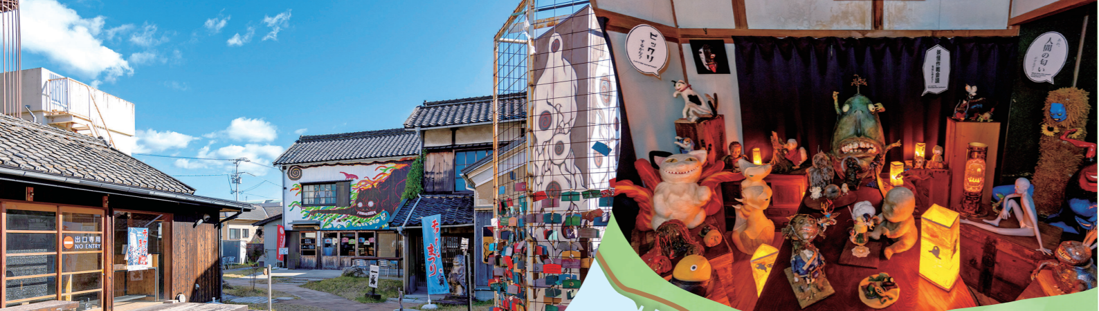
※表紙写真は迷路のまちで西光寺を背景に撮影しました。

「どんな妖怪たちがいるのですか。」ここには古い妖怪だけでなく、SNSで「いいね!」を集める妖怪、テンション爆上げ妖怪など現代の妖怪も展示しています。妖怪には日本人が持つ他者への寛容さや多様性を認める精神が宿っています。つまり私たちの心を映す鏡のような存在とも言えます。美術館では自分の性格にそっくりな妖怪に出会えるはず。皆さんもぜひ探してみてください。