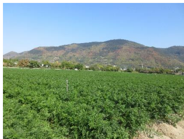
「金時にんじん」栽培ほ場