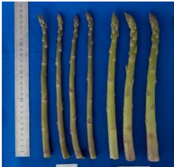
新品種 「あすたま J」 従来品種