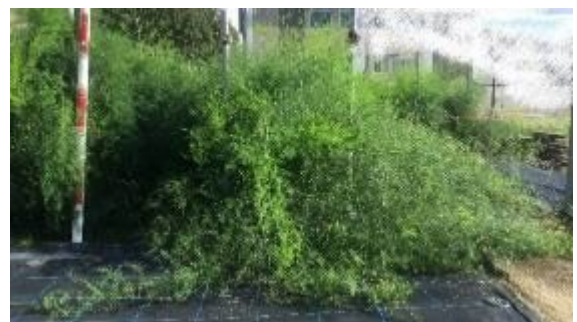
新品種「あすたま J」の草姿