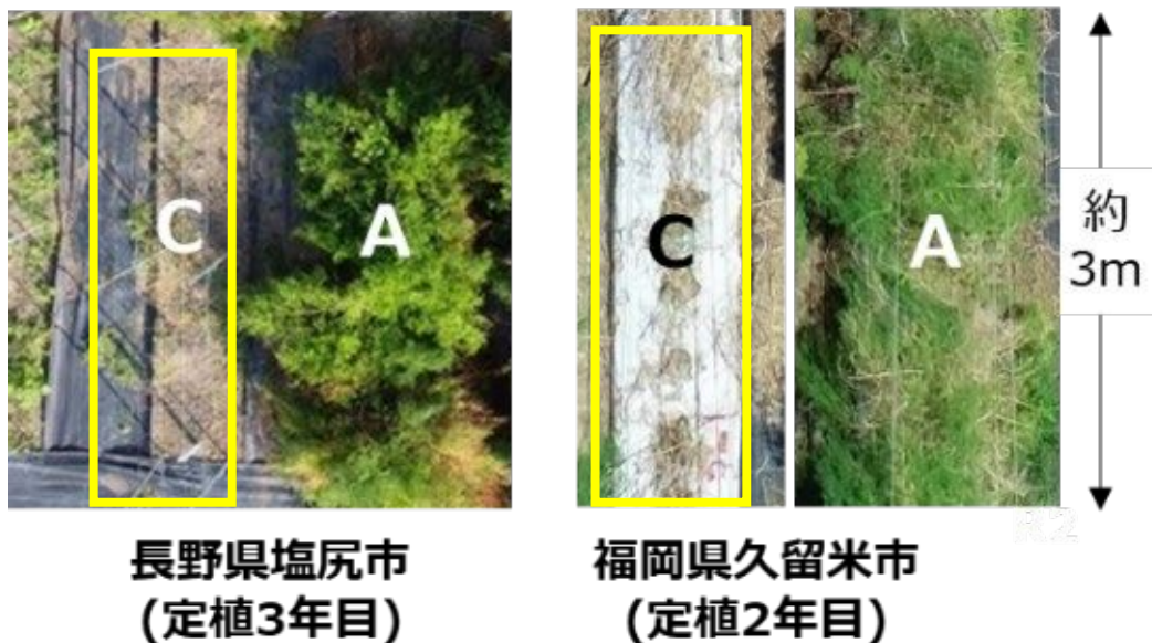
写真3 殺菌剤無散布条件下の露地ほ場での茎枯病発生状況の例 従来品種（黄色囲みの部分）は、茎枯病のため地上部がほぼ枯れている