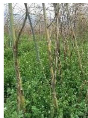
写真1 茎枯病が発生した茎

茎枯病（病原糸状菌： Phomopsis asparagi ）は、アスパラガスの大幅な減収や廃耕などの深刻な被害をもたらす難防除病害の一つで（写真1）、主に降雨により、病斑部から分生子 5) が飛散することによって伝染が拡大します。茎枯病は、特に国内のアスパラガス栽培面積の約80%を占める露地栽培において最も深刻な病害で、近年、高温傾向や長雨、豪雨の影響により、その被害が深刻化しています。また、アジアモンスーン地域の中国、東南アジア諸国、韓国でも問題になっています。