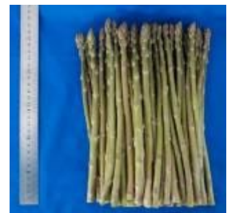
新品種「あすたま J」 の食用部 (長さ 25cm)

また、本品種の名称については、アスパラガスとハマタマボウキの種間雑種であることから、アスパラガスの「アス」とハマタマボウキの「タマ」からとった「あすたま」に、日本固有種を親に持ち、日本のオリジナル性が高いことから Japan の J を付し、「あすたま J」と命名しました。