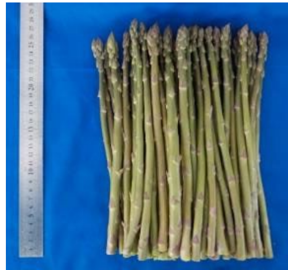
写真 5 新品種「あすたま J」の収穫物（長さ 25cm）