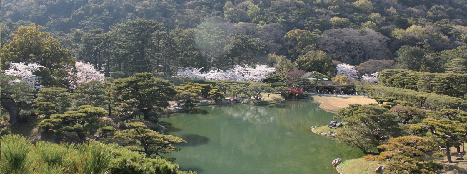
芙蓉峰(ふようほう)から望む春の北湖