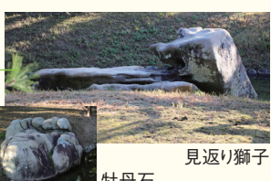
見返り獅子 牡丹石

梅林橋の近くにある二つの自然石。その形が振り返った獅子やボタンの花に似ていることから名付けられました。