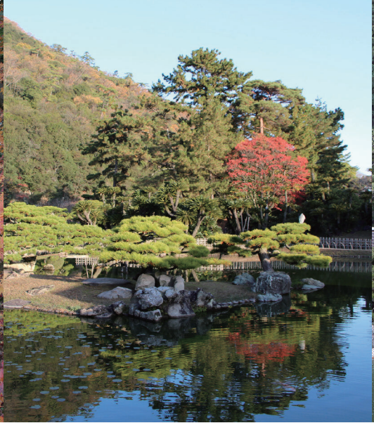
紫雲山の緑をたたえる「涵翠池(かんすいち)」