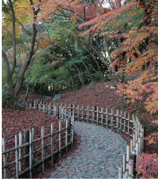
「楓岸(ふうがん)」は紅葉の絶景スポット