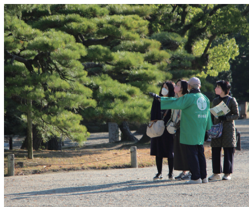
ガイドの説明に熱心に耳を傾ける来園者