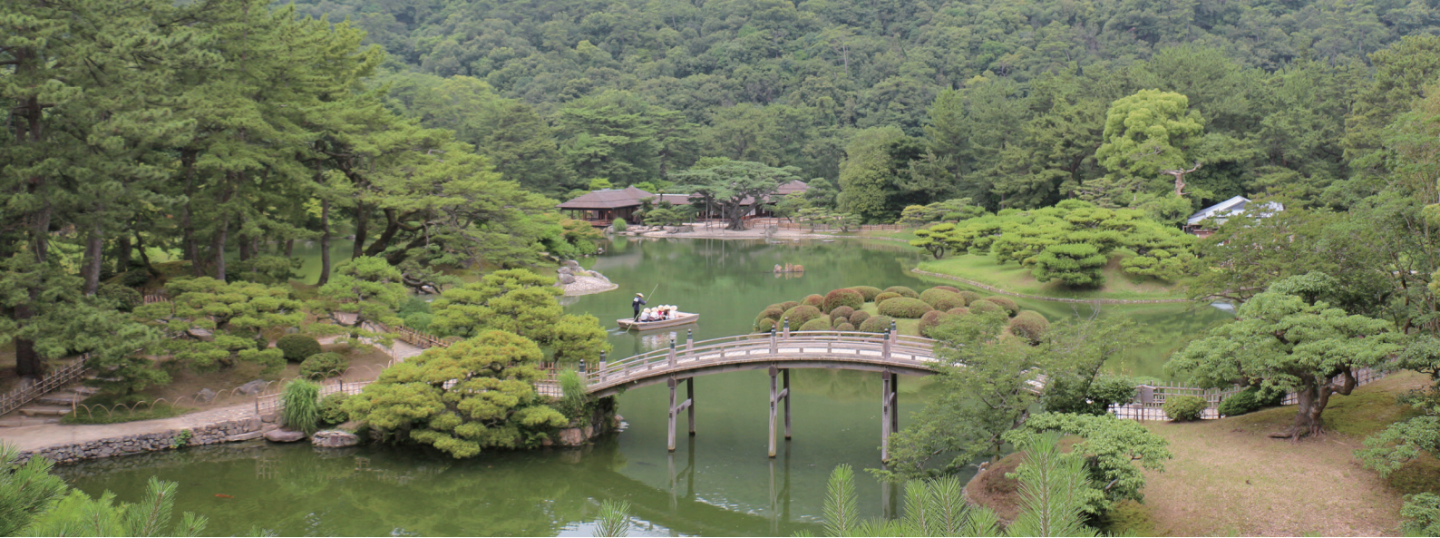
飛来峰から望む初夏の南湖。手前に偃月橋(えんげつきょう)、奥に掬月亭(きくげつてい)