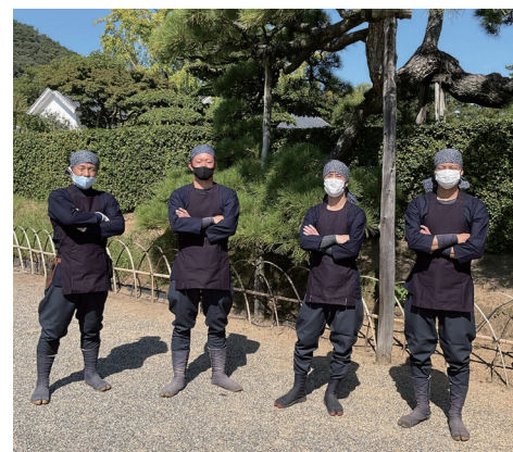
庭師の衣装を江戸時代風に一新