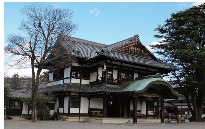
公園の中央にある商工奨励館