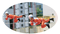
▲消防救助技術四国地区指導会(同時開催)