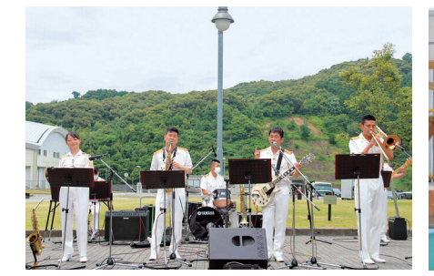
▲陸上自衛隊の音楽隊によるミニコンサート