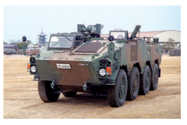
▲消防・自衛隊車両の展示

日時 7月29日(土) 午前9時30分～午後4時 (雨天中止・少雨決行) 場所 香川県消防学校・香川県防災センター