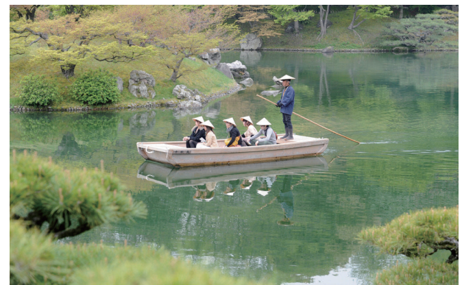
南湖を遊覧する和船