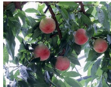
もも栽培園地の様子