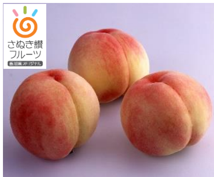
さぬき讚フルーツ 「もも（白鳳系・白桃系品種）」