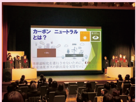
第4回 TAKAMATSU こどもサミット

A. 県、高松市、県内企業・団体が、会合開催の機運を高めるイベントを実施・準備しています。2月に開催された小学生による「TAKAMATSUこどもサミット」をはじめ、まちのにぎわいを創出するカフェの設置や、港湾都市・高松ならではのクルーズなど、県民の皆さまが参加できるイベントを複数開催する予定です。