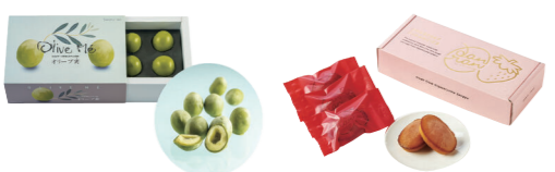
オリーブ実 (株式会社 松風庵かねすえ) エッグベリー・フィナンシエ egg berry・financier (農事組合法人 東山産業)

今年で21回目を迎える「かがわ県産品コンクール」では、香川県のさまざまな魅力あふれる商品を募集しています。募集は「食品部門」「菓子・スイーツ部門」「一般部門」「オーリーブ部門」の四つ。一次審査・最終審査を経て、各部門から最優秀賞の「知事賞」と「優秀賞」を選出します。出品申込書をメールまたは郵送するか、ウェブ上の専用フォームから応募ください。