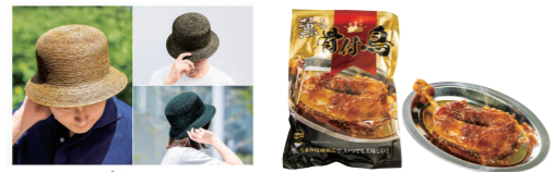
むぎ漆ほうし (有限会社 丸高製帽所) 薫る 骨付鳥 (株式会社 おがた食研)