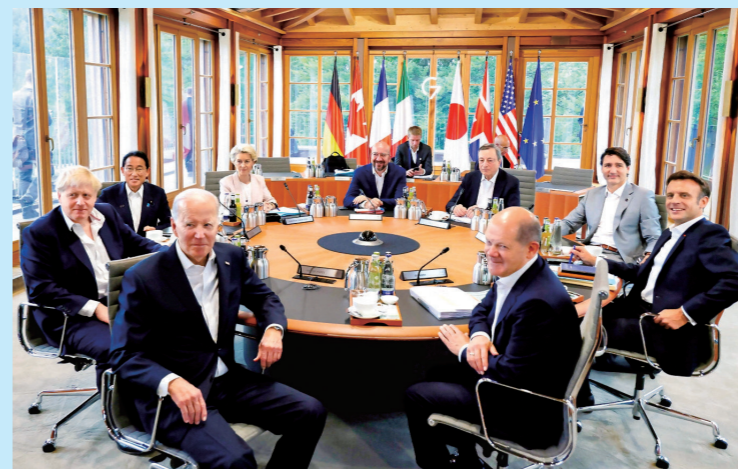
2022年G7サミットの様子

A. G7(Group of seven)は、フランス・アメリカ・イギリス・ドイツ・日本・イタリア・カナダの7カ国とEUのことを指します。サミットは首脳会談以外に「頂点」、「国家の最高レベル」などの意味があり、7カ国の首脳と欧州理事会議長、欧州委員会委員長が集まり、一つのテーブルを囲みながら世界経済や金融情勢をはじめ、国際社会が直面するさまざまな課題について、率直な意見交換を行います。