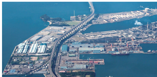
番の州臨海工業団地

さらに、リモートワークの定着などにより、場所にとらわれない新しい働き方も定着しつつあり、地方への事業所展開も進んでいます。