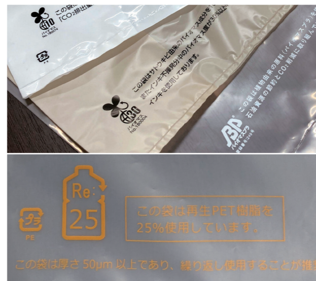
この袋は再生PET樹脂を25%使用しています。 この袋は厚さ50μm以上であり、繰り返し使用することが推奨されています。

問い合わせ先 （公財）かがわ産業支援財団 取引支援課 ☎087(868)9904