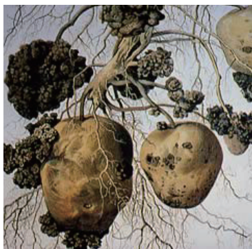
ジャガイモがんしゅ病