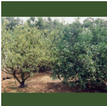
カンキツグリーンング病 (左：感染樹、右：健全樹)