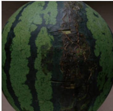
スイカ果実汚斑細菌病