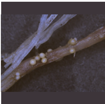
ジャガイモシストセンチュウ (ジャガイモの根に寄生するシスト)