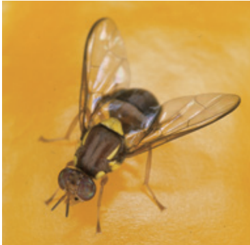
クインスランドミバエ