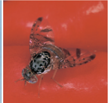
チチュウカイミバエ