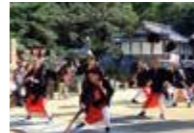
木沢(坂出市玉越町)の奴

香川県の祭礼を賑わすものに、県内で800組とも言われる獅子舞や350台を超えると言われる太鼓台があります。しかし、全国的に見て、より香川の祭礼を特徴づけると言えるのが奴や奴振りです。江戸時代の大名行列が祭礼行列にとり入れられたものとされ、全国で600件ほど報告されているうちの100件ほどが香川県に伝承されています。その知られざる祭礼風流の実態に迫る写真展です。