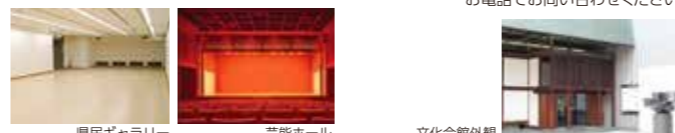
県民ギャラリー 芸能ホール 文化会館外観

県民ギャラリーのほか、芸能ホール、茶室などの施設を備え、各種展覧会、音楽、舞踊、茶会などの文化活動の場として広くご利用いただけます。