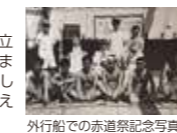
外洋航路での赤道祭記念写真

明治30年(1897)、瀬戸内海の粟島に開校した村立粟島航海学校は、県立粟島航海学校、国立粟島海員学校と変遷し、昭和62年(1987)に閉校するまでの90年間、多くの船員を養成しました。特に外洋航路の船員を多く輩出した粟島には、今も各地の土産品が数多く伝わっています。海外土産から見える世界の国々、そして外洋航路船員やその家族の思い出をたどります。