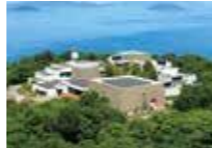
瀬戸内海歴史民俗資料館

瀬戸内海を一望できる五色台の山上に位置し、石積みの外観など地域の風土を意識した建築は「日本建築学会賞」、日本におけるモダン・ムーブメントの建築」などを受賞。収蔵資料のうち約6,000点が国の重要有形民俗文化財に指定されており、常設展示室では木造船や漁撈用具、船大工道具をはじめ、産業に関する道具、祭礼用具など瀬戸内のくらしを伝える民俗資料を展示しています。