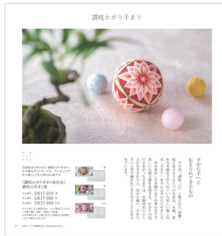
草木染めした木綿の糸で仕上げる、讃岐かがり手まり