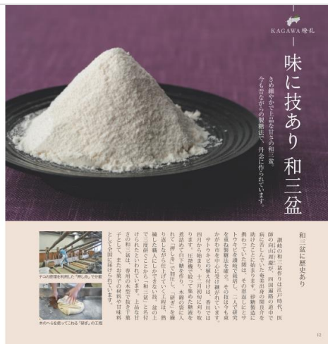
「ばいこう堂」の和三盆(左ページ)と、和三盆の特集ページ「KAGAWA 繚乱」(右ページ)