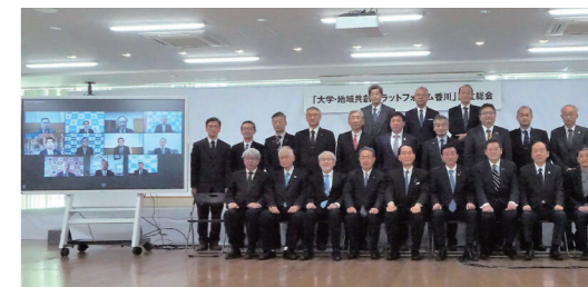
「大学・地域共創プラットフォーム香川」の設立総会

「知」の拠点である大学などの高等教育機関を基点に、県全体の産学官が連携する「大学・地域共創プラットフォーム香川」を3月28日に設立しました。