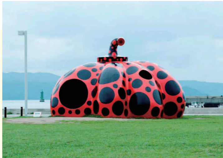
草間彌生「赤かぼちゃ」2006年 直島・宮浦港緑地

直島町は、直島を中心に井島、向島、柏島などの27の島からなります。岡山県玉野市から約2*と近いことから、岡山県とも深いつながりがある島です。1980年代以降から文化・芸術をテーマにした観光に力を入れ、島内には著名なアーティストたちの大型アート施設が建てられました。今では「現代アートの聖地」として、飲食店や宿泊施設も増え、活気にあふれています。