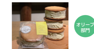
オリーブホワイトチョコ塩サブレサンド (株式会社 FURYU MINORIGELATO)

野武宮の名前を冠した菓子、一般部門は香川漆器の5つの技法をそれぞれ用いて動物柄を表現したカップ、オーリーブ部門はジェラートに小豆島産新漬けオリーブのペーストをふんだんに使ったスイーツが知事賞に選ばれました。応募期間は6月30日(木)まで、郵送の場合は当日必着とします。申込書に必要事項を記載し、写真など内容が分かるものを添付して送付してください。食品の場合は、食品表示に関するパッケージやシールが必要です。詳しくは、香川の県産品ポータルサイト「LOVEさぬきさん」をご覧ください。たくさんのお応募をお待ちしています。