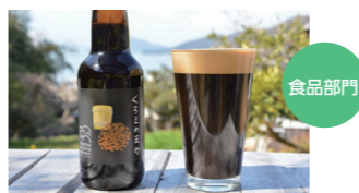
くらめまめ (合同会社 ナカタ / まめまめびーる)