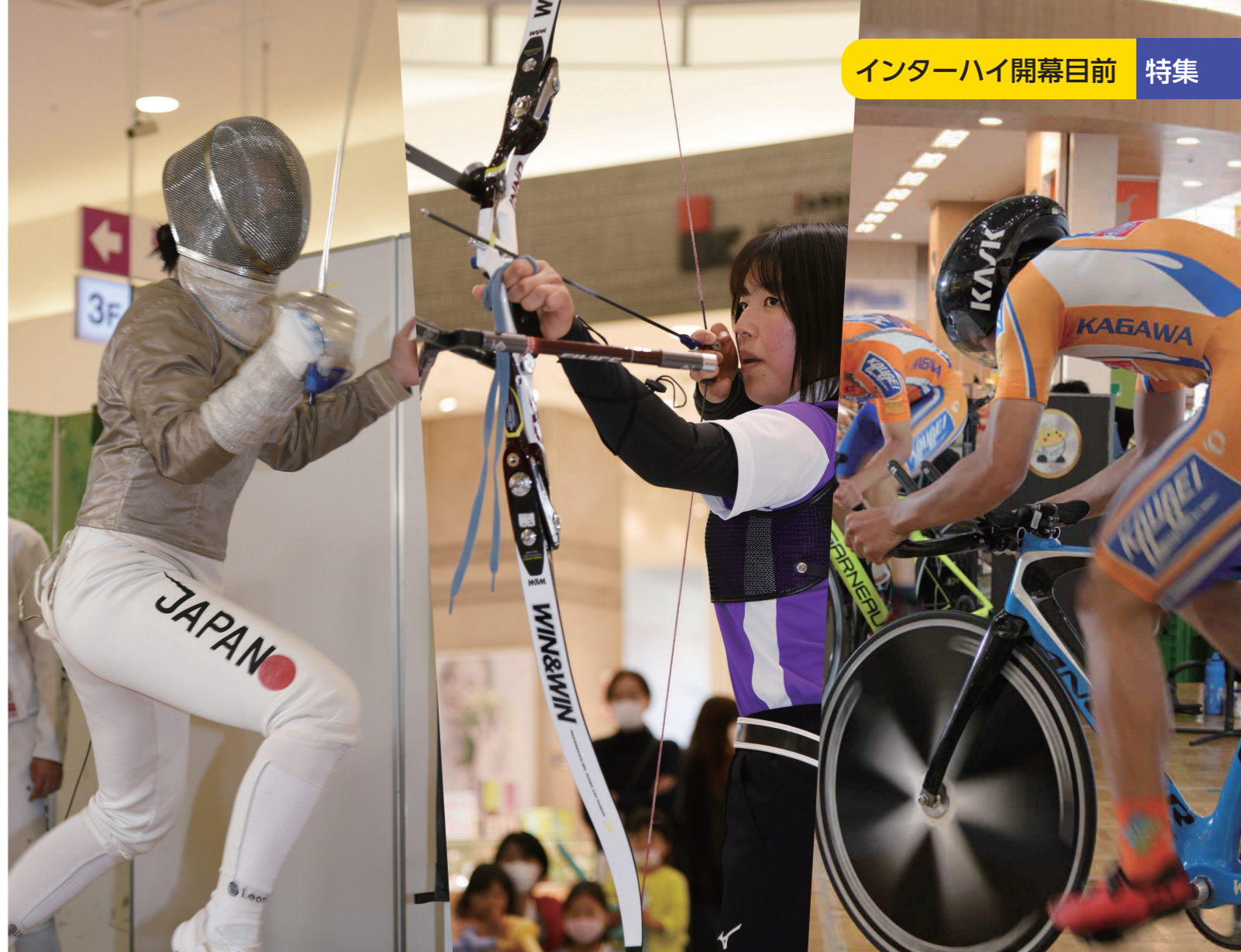
大会100日前イベントでデモンストレーションを行う高校生