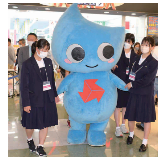
マスコットキャラクターの「ウイノンくん」

高校スポーツ最大の祭典、全国高等学校総合体育大会(インターハイ)が、四国を舞台に7月23日から始まります。インターハイの四国開催は、香川県が主催地となった1998年以来24年ぶりのこと。今回は主催地の徳島県を中心に四国4県(ヨット競技は和歌山県)で行います。香川県は7月26日から、バスケットボールやフェンシングなど9競技10種目を開催。「燃え上がり 我らの闘志 四国の大地へ」をスローガンに、全国から優れた若きアスリートが集結し、約1カ月間の熱戦を繰り広げます。