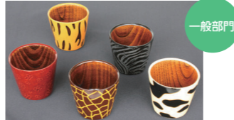
香川漆器~5つの技!動物園シリーズ~ (一和堂工芸 株式会社)