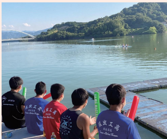
ハンガリーチームの練習を見学する生徒たち

東京2020オリンピックでは、全国各地で大会出場に向けた海外選手団の事前合宿が行われました。香川県ではハンガリーのカヌースプリントチームが坂出市で、クロアチアの陸上競技チームが丸亀市で本番に向けて調整しました。新型コロナウイルス感染症の影響で、選手と直接、触れ合うような交流はできませんでしたが、地元の小中学生と高校生が練習を見学し、トップアスリートのすごさを体感しました。