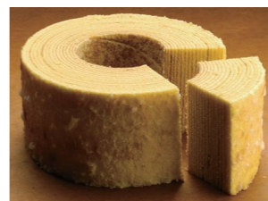
「さぬきの夢」を使ったパウムクーヘン

対象店舗で注文または購入した「さぬきの夢」を使った商品の画像に「#さぬきの夢食べたよ」を付けて、ツイッターまたはインスタグラムで投稿すると、抽選で「ヤドングッズ」が当たります。(各回 150人)