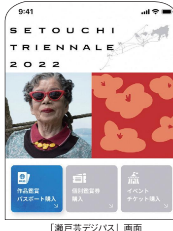
「瀬戸芸デジパス」画面

StoreまたはGoogle Playからダウンロードできます。前売り券は、11月9日(火)から、瀬戸芸デジパス限定で3シーズンパスポートを4000円の前売り特別価格で販売中。(16、18歳は3100円、15歳以下は無料)紙のパスポートの前売り券の販売時期は、後日ホームページなどでお知らせします。 作品鑑賞パスポートを購入した方には、有料イベントや公式ショップで販売している商品の割引(回数に制限あり)、専用駐車場の無料利用(回数に制限あり)など、お得な特典が付いていますので、ぜひ早めにお買い求めください。