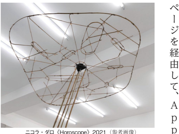
ニホラ・タロ (Horoscope) 2021 (参考画像)

作品鑑賞パスポートも デジタルに 今回の芸術祭から、全ての会期で有効な「3シーズンパスポート」(5000円)と春・夏・秋それぞれの会期のみ有効な「会期限定パスポート」(各4200円)を「瀬戸内国際芸術祭2022デジタルパスポートアプリ」(通称:瀬戸芸デジパス)で販売します。 瀬戸芸デジパスは、瀬戸内国際芸術祭公式ウェブサイトの「作品鑑賞パスポート」のページを経由して、App