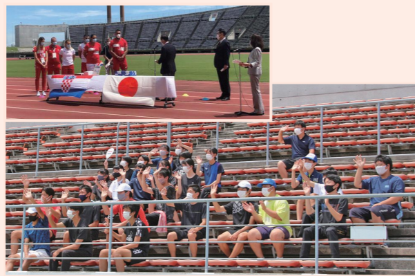
クロアチア代表の練習を見学する生徒たち