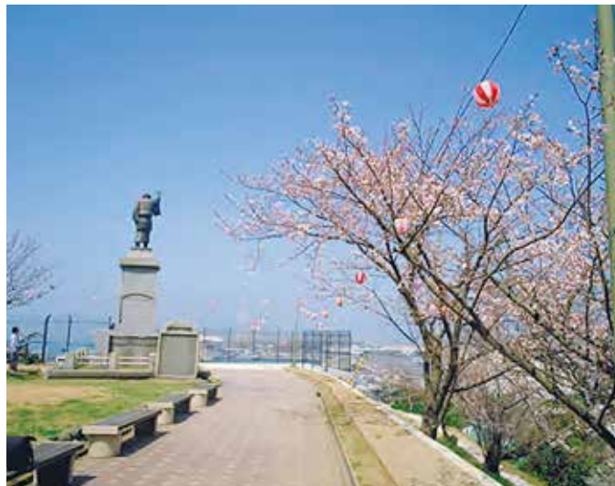
▲一太郎やあい像のある展望台