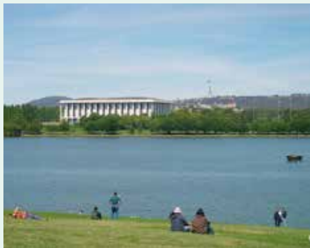
▲手前はコモウエールパーク（豪）

全国の一人大あたり都市公園等面積が平成28年度末に約10.4㎡/人に達しましたが、東京都特別区など、既成市街地や人口・諸機能の集積が著しい地域では、海外諸都市と比べ依然として低い水準にあり、一層の整備が求められています。