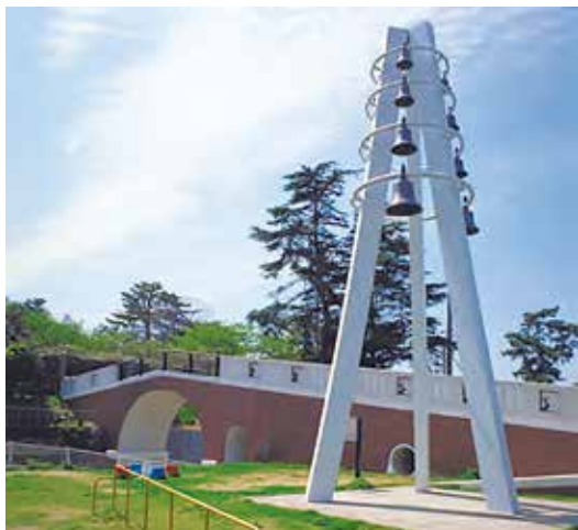
▲美しいメロディーを奏でるカリヨン時計