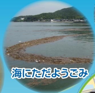
海にただようごみ