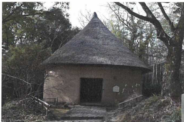
砂糖しめ小屋（旧富木田家）

当該物件は土壁の虫害と、入り口の扉の修理を長期修理計画（現時点では令和7年度）にて計画していた建物。