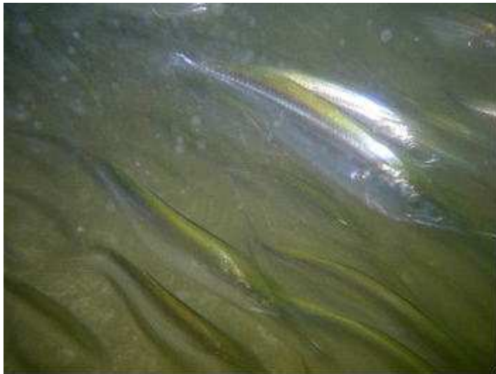
小田中間育成場から海へ出て行くサワラ

5月の11日、12日に水産試験場、水産課、県漁連及び水産総合研究センター屋島栽培漁業センター【以下、水研屋島センター】と共同し、14日には、岡山県栽培漁業センターも加わり夜間の採卵に出航しました。