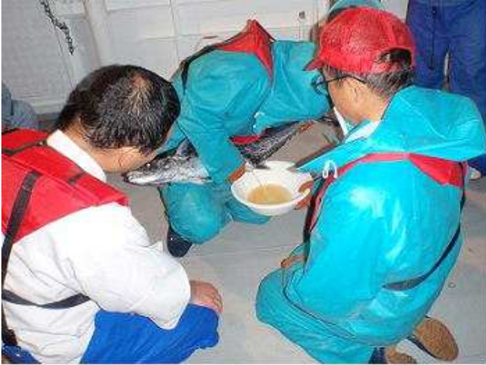
水研屋島センター・岡山県栽培漁業センターと共同で採卵

香川県は、これまでも日本で一番多くの大型サワラ種苗を放流し、漁業者と一丸となって瀬戸内海系群サワラの資源管理取り組んでいます。