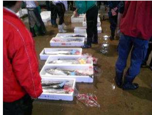
香川県のさわら流しさし網で漁獲されたサワラが高松市場へ入荷されました