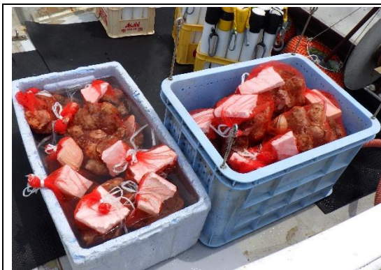
玉ねぎ袋に小分けして運搬