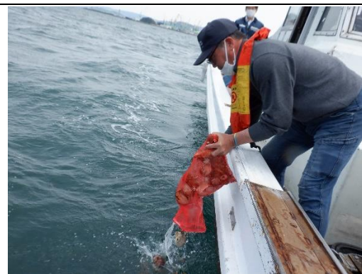
漁業者も放流に参加

このまま海底ですくすくと成長し、元気な稚イイダコとなって資源に加入してくれることを期待しています。