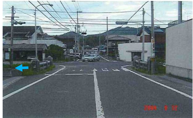
道路状況(左岸側から撮影)