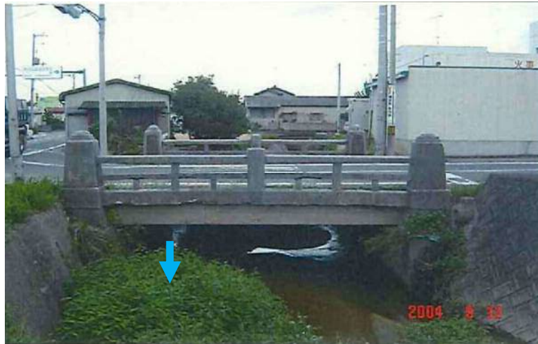
橋梁側面(下流から撮影)