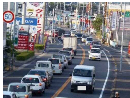
国道11号の渋滞状況 (観音寺市内)