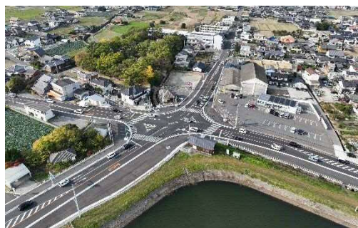
県道長尾丸亀線（川西北工区） 右折レーンの設置

県内において、ボトルネックとなっている主要渋滞箇所や事故が多い交差点について、渋滞及び事故要因に応じた対策を推進します。