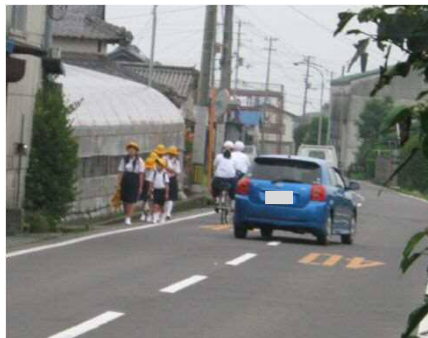
県道粟井観音寺線 通学時の危険な状況

ユニバーサルデザインの実現等、歩行者の視点からの整備に加え、自転車活用推進法の施行等、環境にやさしい交通手段として着目されている自転車を含めた走行空間の確保を図ります。