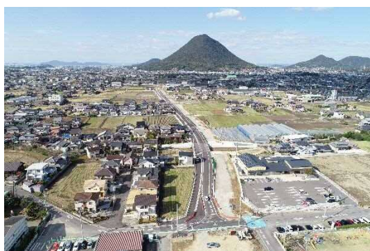
国道438号(飯山バイパス)

一部の幹線道路では、交通量が多いために混雑し、幹線道路としての役割を果たせていない道路があります。それらの道路については、道路拡幅やバイパス整備により、交通の円滑化を図ります。