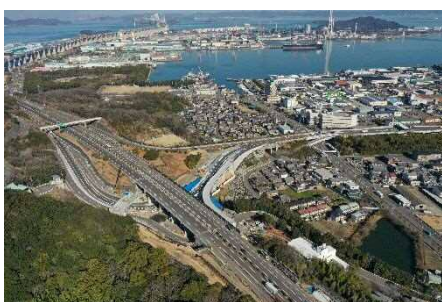
フルインター化の整備を進める坂出北インターチェンジ

また、高速道路インターチェンジの整備により、高松自動車道へのアクセスの向上を図ります。