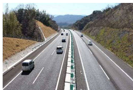
高松自動車道の4車線化整備 (東かがわ市馬篠：2019年3月完成)