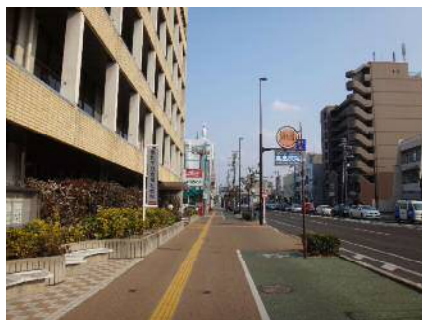
(都) 中新町詰田川線 無電柱化により電柱倒壊による寸断を防止

南海トラフ地震の発生確率が高まる中、避難活動や救急救助活動をはじめ、物資の供給、諸施設の復旧等の広範な応急対策活動を広域的に実施するために、緊急輸送道路の円滑性の向上を図ります。