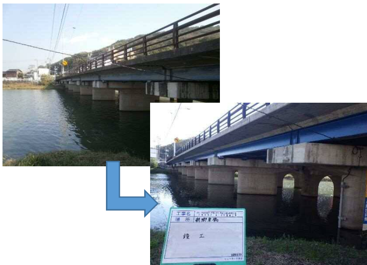
損傷した橋梁の修繕による長寿命化

高度経済成長期に整備された橋梁等の大型構造物を有効に活用するため、戦略的・計画的な橋梁等の修繕や耐震化を推進します。