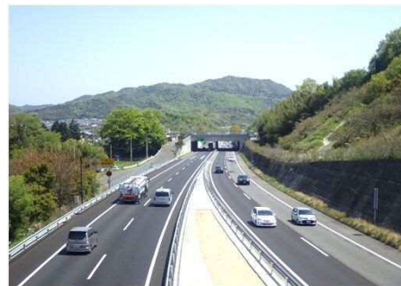
高松自動車道の4車線化整備 (三木トンネル付近：2018年11月完成)