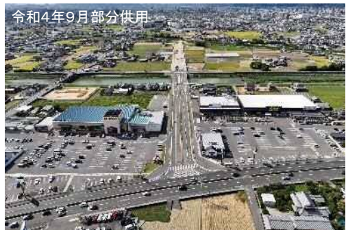
県道太田上町志度線（六条工区） ことでん新駅（太田～仏生山駅間）への アクセス道路