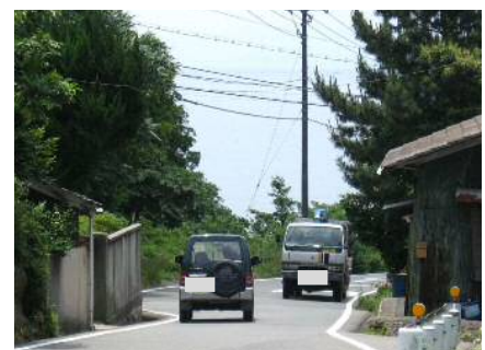
国道436号(外明神工区) 線形が悪く、幅員も狭小