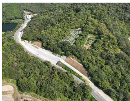
県道高松坂出線(五色台工区)