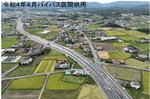
県道円座香南線（香南工区） 高松空港へのアクセス道路