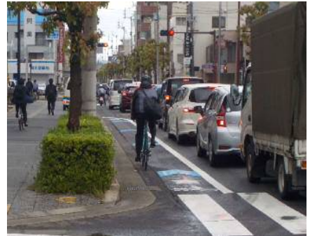
県道高松港栗林公園線 矢羽根型路面表示の設置