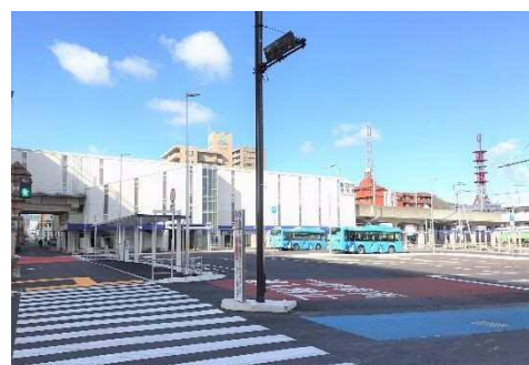
ことでん新駅（伏石駅） 駅前広場の整備

駅周辺では、歩行者や自転車が安心して快適に通行できる空間を確保する等、駅へのアクセスの向上を図ります。