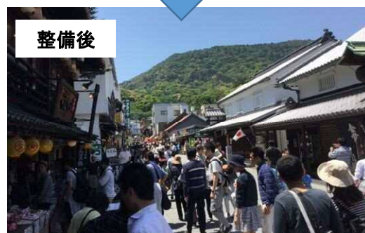
県道琴平停車場琴平公園線 電線共同溝による無電柱化