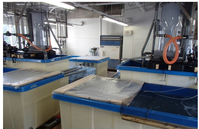
閉鎖循環システムを使用した陸上養殖試験