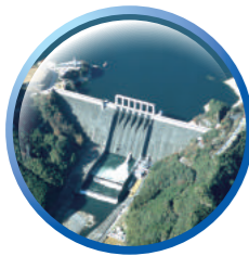
早明浦ダム(高知県)

高さ106メートルの四国地方で最大のダムです。香川用水もこのダムの水を利用しています。