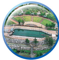
香川用水東西分水工

高さ24メートルの池田ダムから阿讃山脈をつらぬく「導水トンネル」を通じて香川用水につながっています。