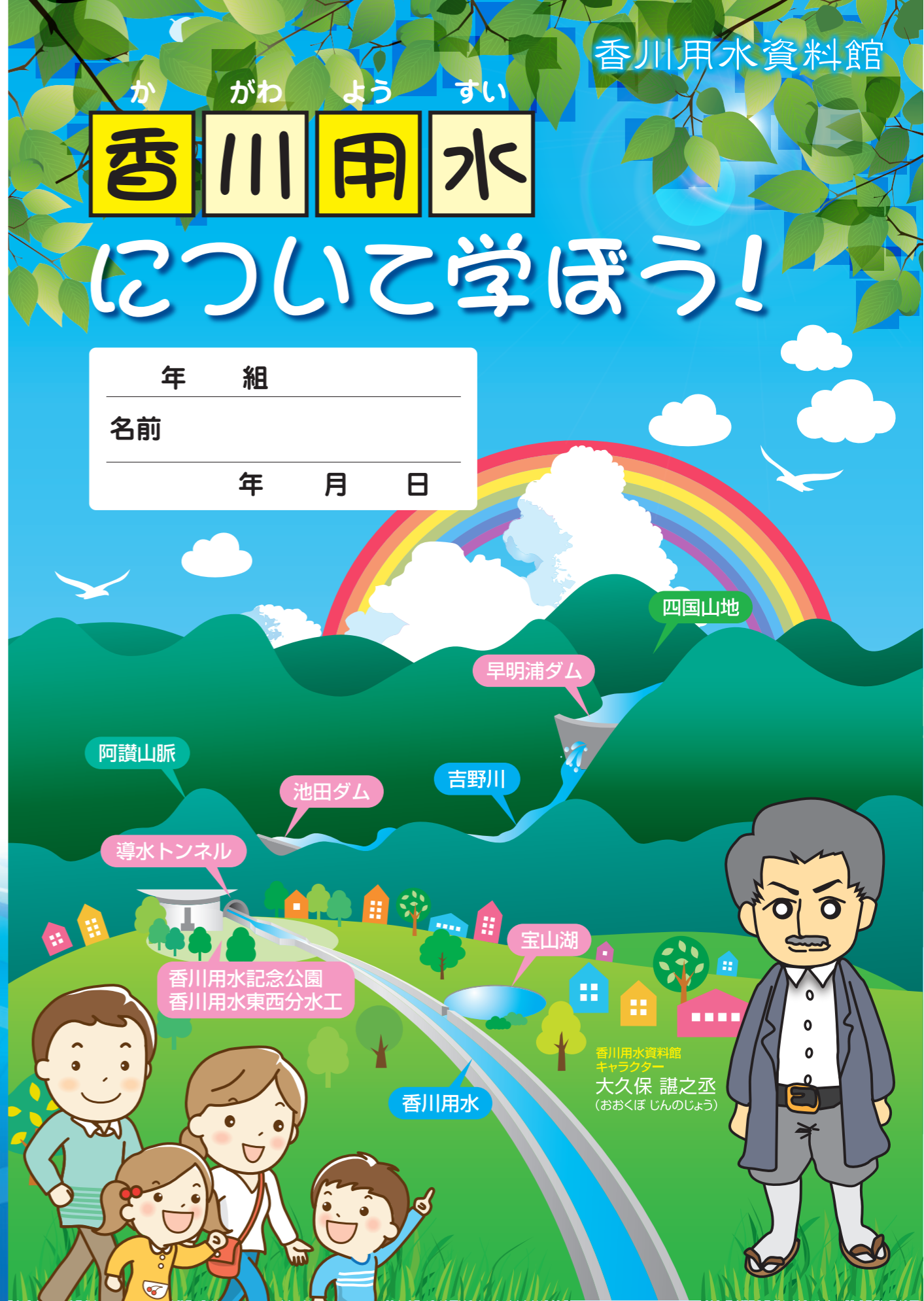
香川用水資料館 キャラクター 大久保 謙之丞 (おおくぼ じんのじょう)

香川県農政水産部土地改良課 高松市番町四丁目1番10号 TEL087(832)3439 香川用水土地改良区 高松市番町五丁目1番29号2階 TEL087(802)5711