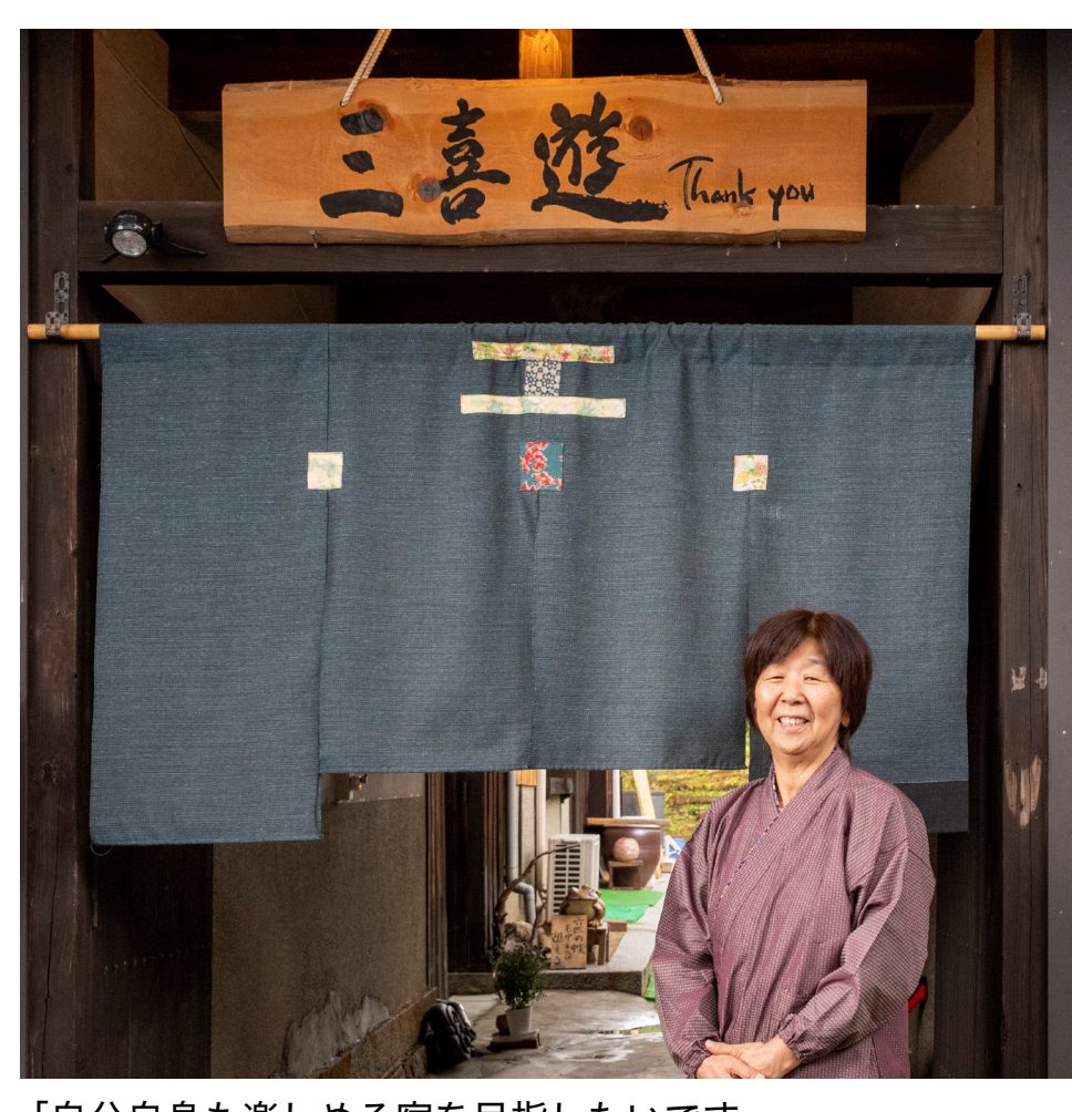
「自分自身も楽しめる宿を目指したいです」

それらが落ち着いたら、宿の“離れ”を改装し、スペースを拡大したいです。まだ手つかずの場所なので、実行するならまた一からの整備となるのですが、宿を広くできれば今、社会的にも需要が伸びつつある“ワーケーション”への対応も考えたいですね。ゆったりした時間が流れるこの民宿で、仕事も余暇も充実していただけたら素晴らしいですよ。だからぜひ実現したいです。慌てず頑張っていこうと思います。