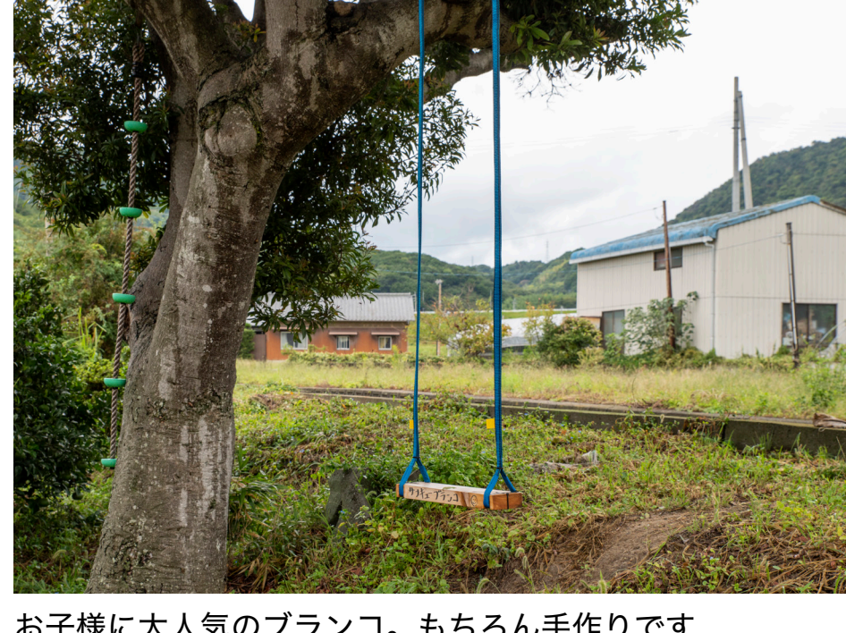
お子様に大人気のブランコ。もちろん手作りです

お越しになる方は関西方面の方がいちばん多いのですが、東京や仙台など遠方から来られる方も少なくないです。家族や友人同士、おひとりですらいらっしゃる方など人数は様々ですが、皆さんゆったりのお過ごしされています。その姿を見て、こちらも癒やされますね。