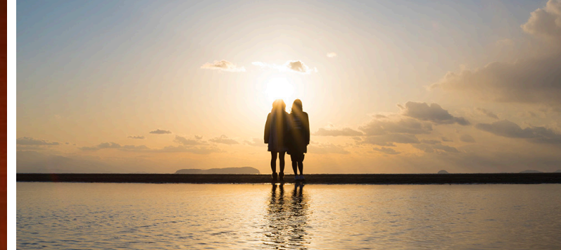
ここでしか出会えない味と景色が人気です