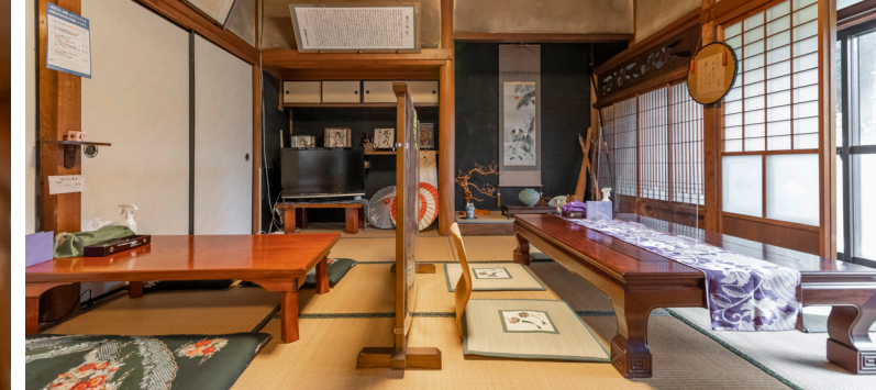
古風な趣が、時の流れを緩やかに感じさせる