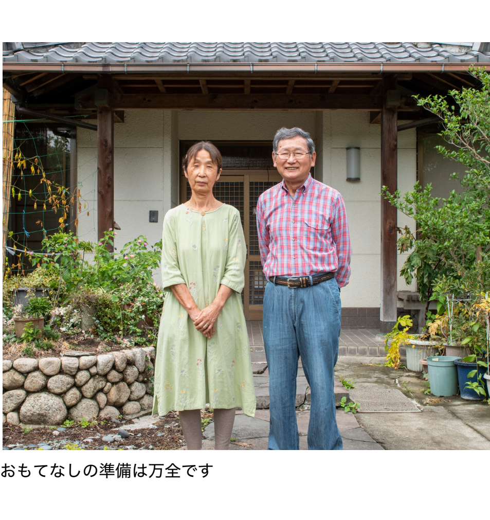
おもてなしの準備は万全です

人とのふれあいを重ねていきたい、ということは何度もお話ししました。でもそれは個人的な目標で、私にはもうひとつの夢があるんです。それは住んでいる街にもっと農林漁家民宿を増やしたいんです。とりあえず3~5件が目標で、その民宿がお互いに自分の宿の自慢を育てながら、それを相互で活用できるようにしたい。例えばミカン狩りができる宿は、その特徴をほかの宿が利用できるように協力するみたいな感じです。そんな体制ができれば、きっと空き家ができる一方の街の活性化にも役立つと思うんですよ。夢は「都会の子どもたちの修学旅行を、私たちの街で受け入れる」ことでしょうか（笑）。実際、知人のお寺が民宿を近々はじめますので、私は菜園を、お寺は精進料理をというような事ができないかと考えています。まだまだ未知数ですが、頑張っていきたいと思っています。