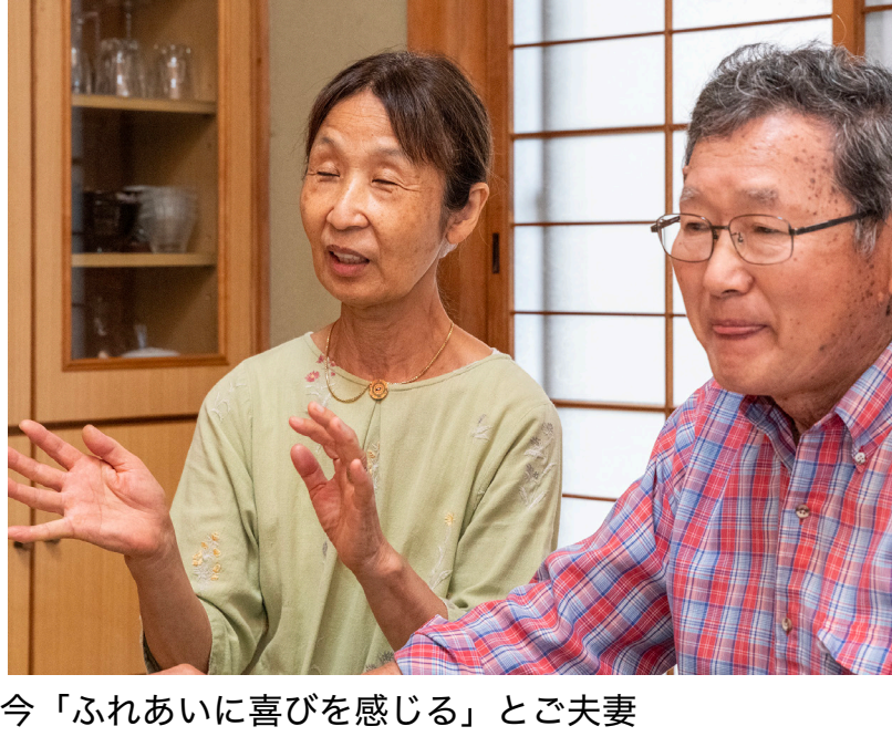
今「ふれあいに喜びを感じる」とご夫妻

若い頃から旅が好きで、夫婦で色々な場所を巡っていました。それが年を重ねるに従って、旅の興味は名所やグルメ観光より人とのふれあいを求めるようになったんです。ある時、愛媛の民宿の方と親戚のようなおつきあいが始まり「こんな家族的で落ち着いた旅の宿を自分たちでもしてみたい」と考えるようになったのが最初ですね。妻は当初は反対していましたが、これまでに海外のホームステイを受け入れたり、カヌー大会のチームの宿泊先として若者の面倒をみたりするなど、本来、人との交流が好きでしたのでいつしかOKを出してくれていました。今はこの民宿で多くの方との交流を楽しみながら、夫婦の絆も深められたらと思っています。