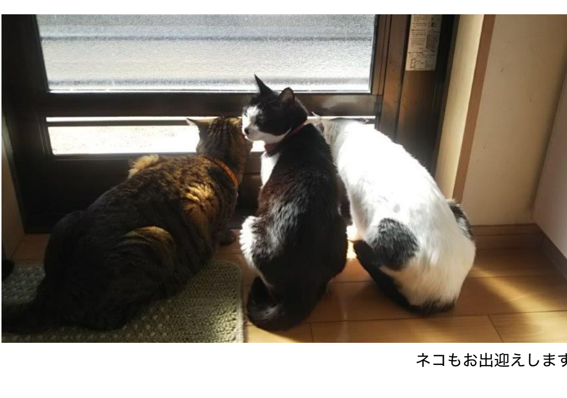
ネコもお出迎えます

これからのエピソードもないのですが、私が若い頃から訪ねている九州の民宿のご主人が民宿とは「一度泊まれば遠くの親類。十度泊まればほんとの親戚」という言葉を話されていたんです。この言葉、その通りだなあと感じて訪れた方が何度もリピートしたくなる宿に育てていきたいです。