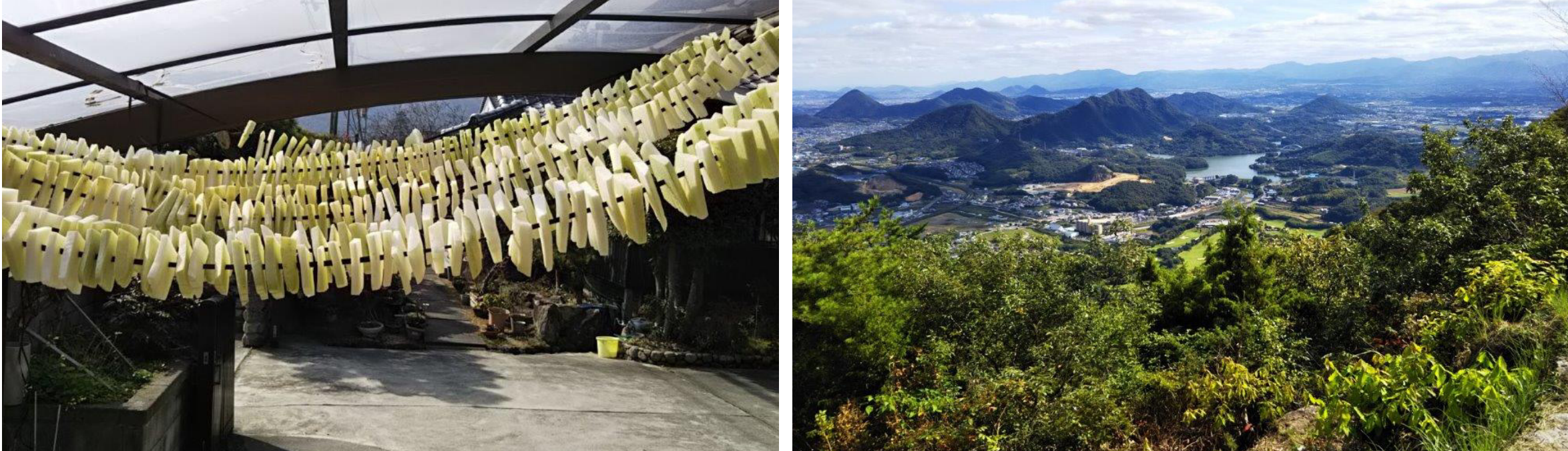
懐かしい風景、懐かしい味が心地いい

はじめる時のハードルが、他の旅館業より低いと思います。つまり、やりたいと思う気持ちさえしっかり持っていれば実現するところですね。また、一緒に料理を作ったり、自然を散策したり、お客様自身が私たちの何気ない普段の生活を味わうことができます。そんな、ホテルに泊まる名所観光では決してできない“人と人との交流が深まる旅の提供”ができるところが魅力だと思いますね。