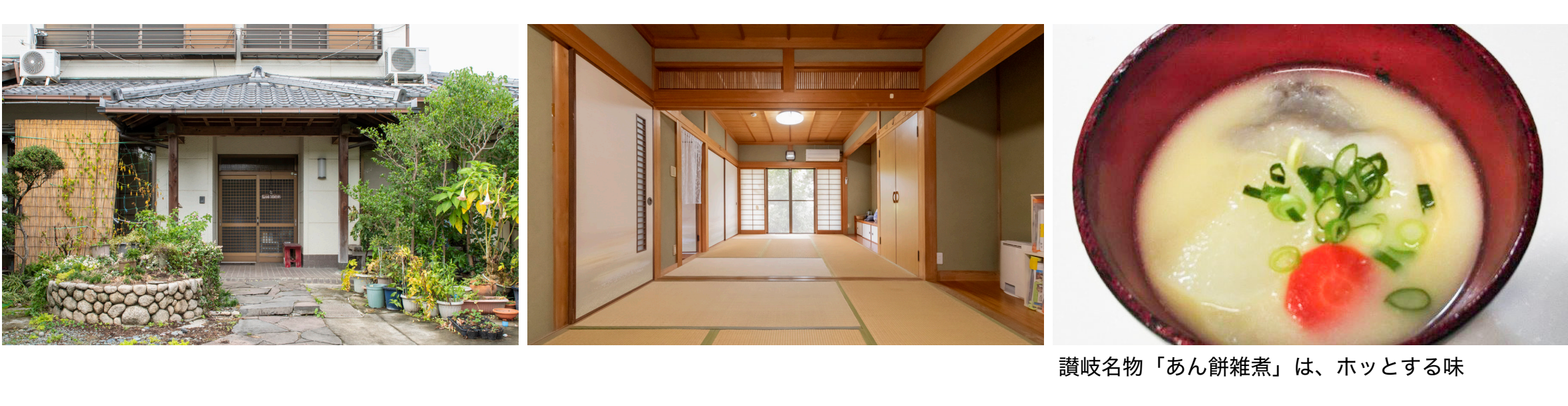
讃岐名物「あん餅雑煮」は、ホッとする味

二世帯住宅の離れをリフォームし、使用しています。部屋はダイニングキッチンに、居間と6畳のお部屋2つを自由にお使いいただけるように準備しています。宿泊していただく方の定員は3名ですので、十分ゆったりと寛いでいただけます。食事は家庭菜園で収穫する季節の野菜や果物を使い、この界隈の郷土料理と一緒に作って味わっていただきます。特に讃岐のあん餅雑煮、押し寿司は是非オススメしたいですね。宿泊費用としては、素泊まり5,000円、夕朝食付8,800円で、小学生までのお子さまはその半額をいただきます。体験プランは「うどん打ち」「こんにやく作り」おはぎなどの「和菓子作り」などの料理を楽しんだり、「野菜・果物の収穫」に汗をかいたり、近隣の「里山散策」など色々あります。5月頃にはタケノコ掘りもできますよ。