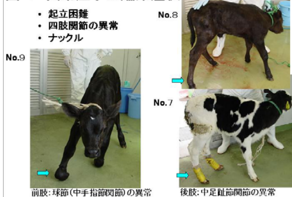
図-1 異常産子の臨床症状