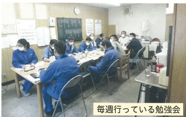
毎週行っている勉強会