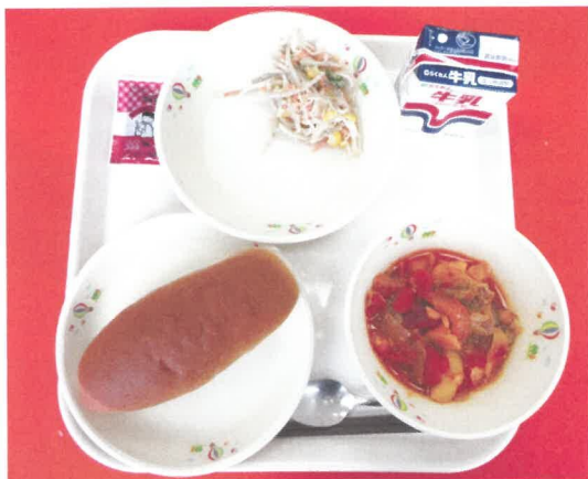
コッペパン、大豆バター、ボルシチ、ごぼうサラダ 牛乳