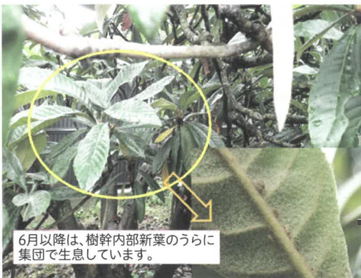
6月以降は、樹幹内部新葉のうらに集団で生息しています。