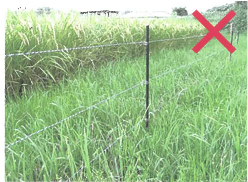
雑草が電線に接触している