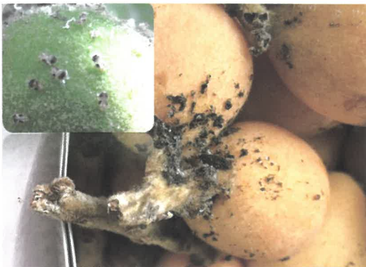
「キジラミ(幼虫)と白い甘露」と「黒すす病」