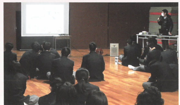
農業青年によるプレゼンテーションの様子

普及センターは、今後も関係機関と連携して地域農業への理解促進や担い手の育成に努めていきます。