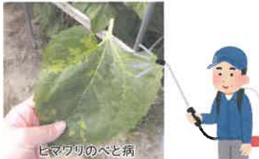
ヒマワリのべと病