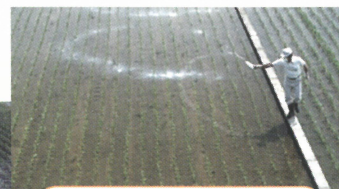
フロアブル剤の散布