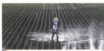
散粒機による粒剤の散布