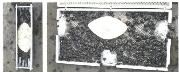
捕獲器によるジャンボタニシ捕獲状況