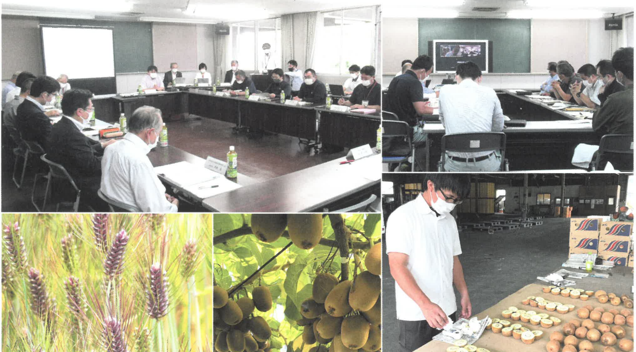
上段：7月に開催された第1回推進協議会の模様(左)、キウイフルーツ部会での検討(右) 下段：讃岐もち麦「ダイシモチ」(左)、さぬきキウイっこ®(中)、収穫前のキウイフルーツ品質調査(右)

善通寺市では、国の地方創生推進交付金を活用し、3年間の計画でこれからの農業振興を図るため、讃岐もち麦「ダイシモチ」とキウイフルーツを重点作物に位置づけて高付加価値化を図り、足腰の強い農業の実現に向けた「善通寺市強い農業推進協議会」（以下、協議会と呼称）を7月に設立し、普及センターも、JA香川県や関係企業、生産者組織等とともに参画しています。