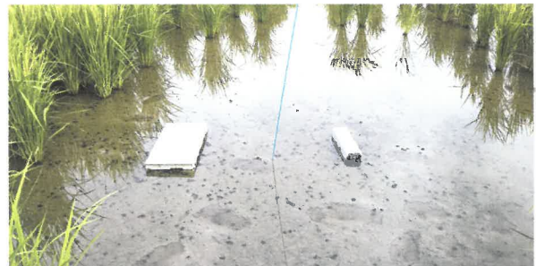
捕獲器の設置状況