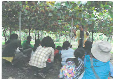
キウイフルーツ産地交流会（善通寺市）