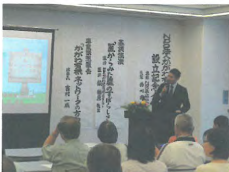
NPO法人設立記念講演会