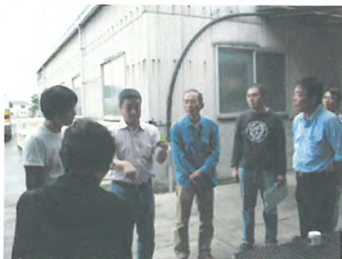
「のれん分け就農」に取り組む農業法人の視察