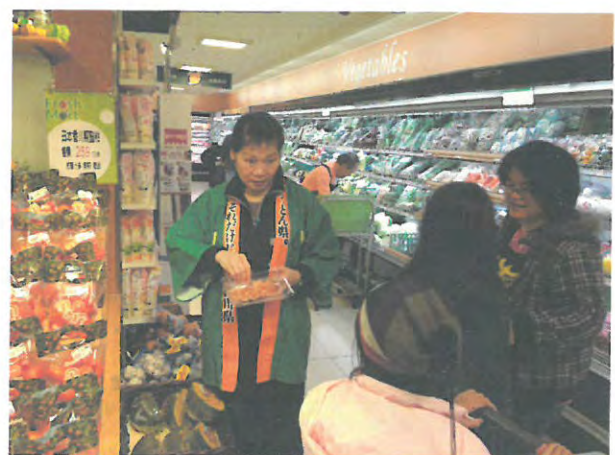
台湾での「小原紅早生」販売