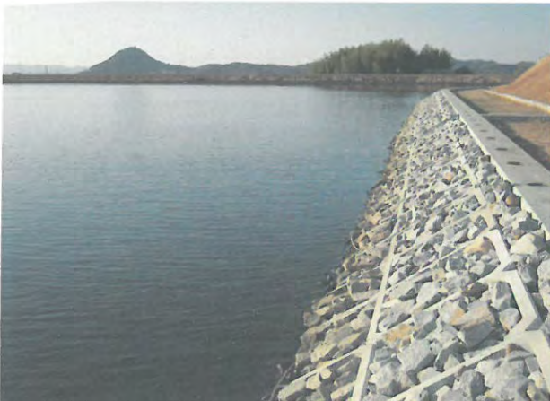
ため池の水辺環境整備