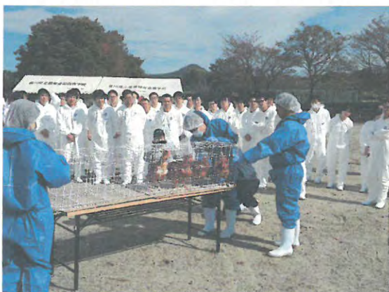
鳥インフルエンザ防疫演習