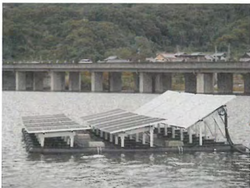
ため池を活用した太陽光発電施設導入実証実験の実施状況