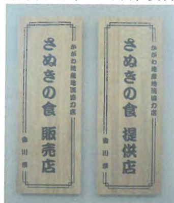
「かがわ地産地消協力店」の目印認定プレート