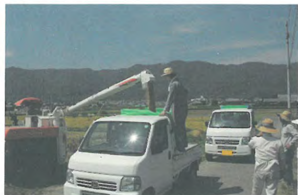
導入した共同利用機械による稲刈り