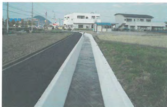
長寿命化対策後の農業用水路