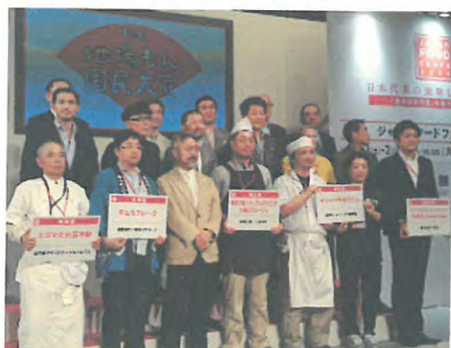
第2回地場もん国民大賞にて銀賞受賞