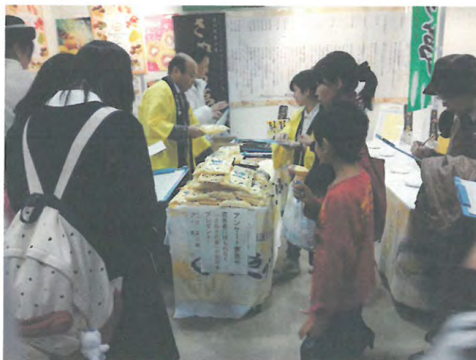
食の大博覧会での県産小麦のPR