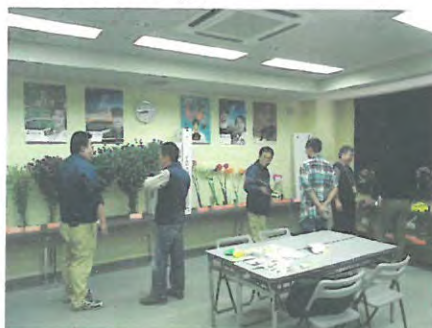
「なにわ花いちば」で香川県産花き展示会を実施