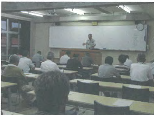
集落営農法人による講義(集落営農塾)