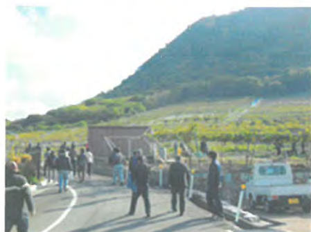
就農希望者のためのアグリツアー