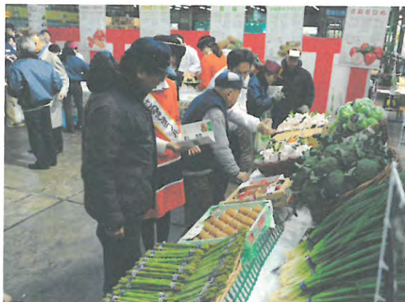
買参人への商品説明（大田市場）