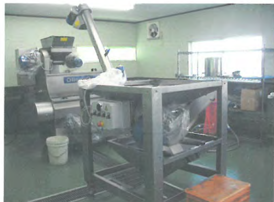
オリーブオイル採油機の整備