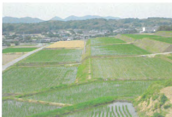
区画整理事業が完了した優良農地