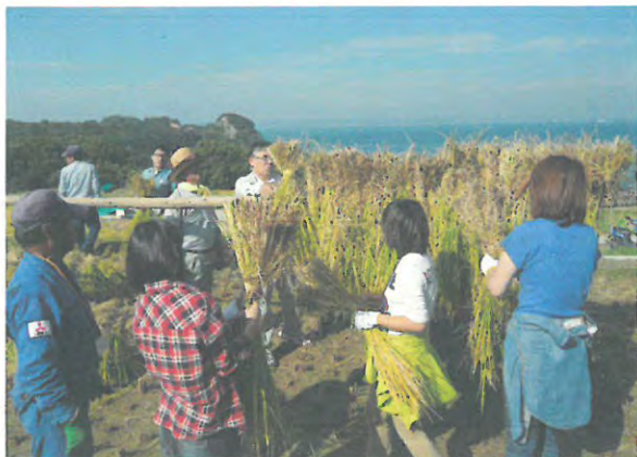
稲刈り体験ツアー