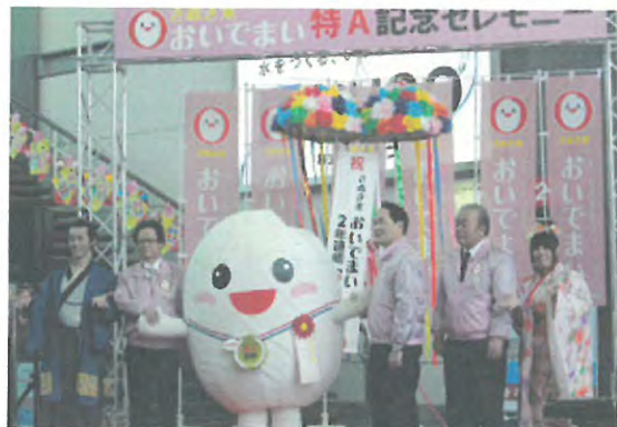
「おいでまい」特A記念セレモニー