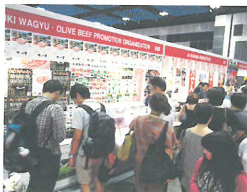
“Oishii Japan” 香川県ブース（シンガポール）