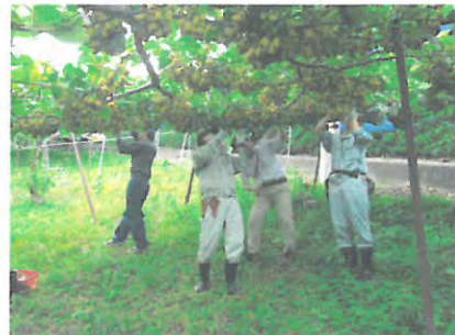
「さぬきキウイっこ」適正着果量の指導