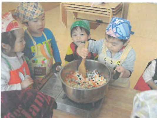
「かがわ地産地消応援事業所」で行われる園児の調理体験