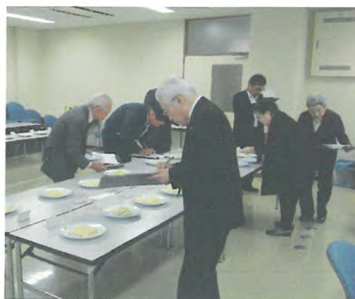
「『さぬきの夢』うどん技能グランプリ」審査風景