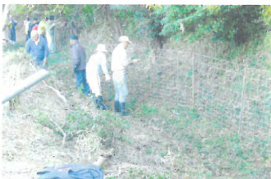
集落ぐるみによる侵入防止柵の設置