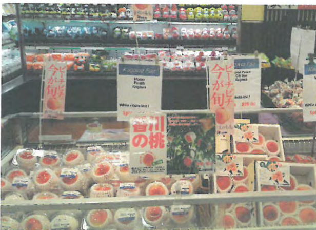
シンガポールでの「もも」販売