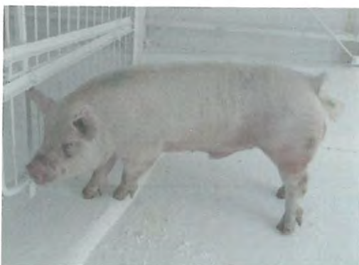
県外から導入した優良種雄豚