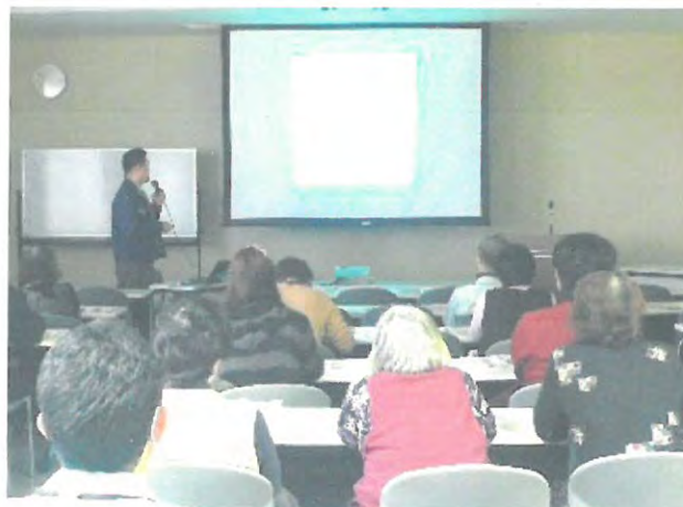
農業生産工程管理(GAP)講習会