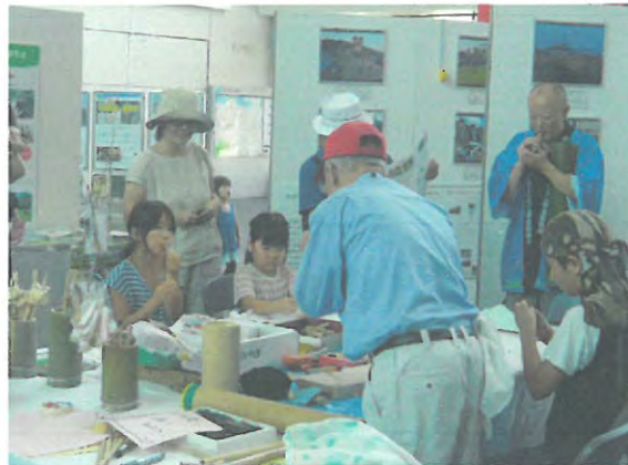
グリーン・ツーリズムフェア