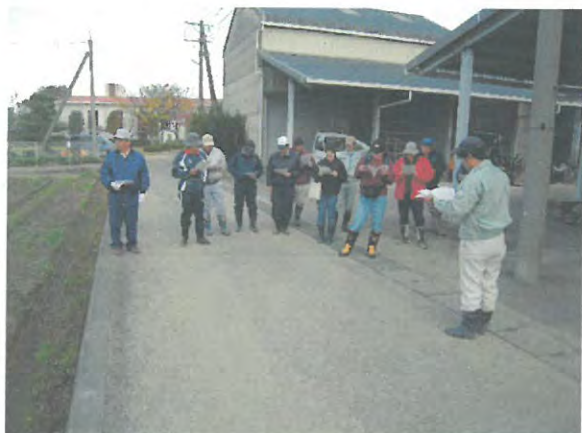
作業実施の打合せ