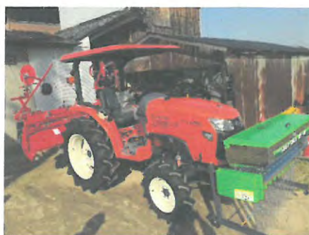
経営発展支援事業で整備された農業機械