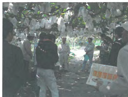
新品種による経営改善指導