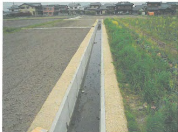
小規模な農業用水路の改修