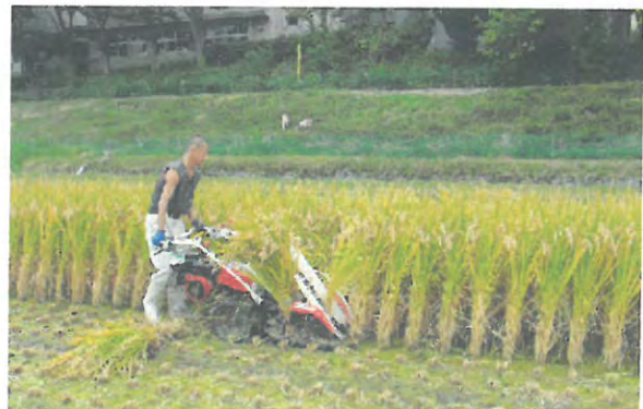
飼料用イネ専用品種”ホシアオバ”