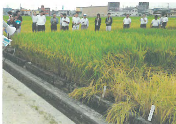
飼料用米や主食用多収性品種の栽培技術の確立