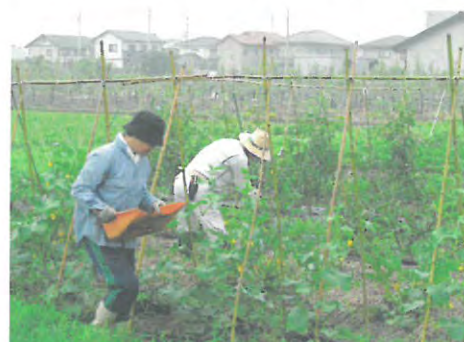
有機農業体験ほ場