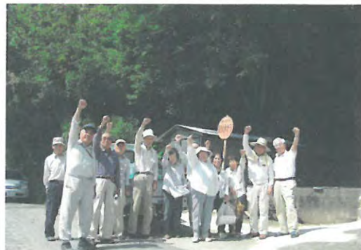
追い払い活動団結式