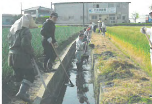
協働による農業用水路の保全活動