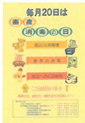
「畜産消毒の日」の農家周知用パンフレット