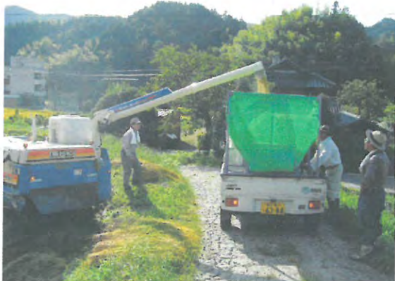
担い手による農作業支援