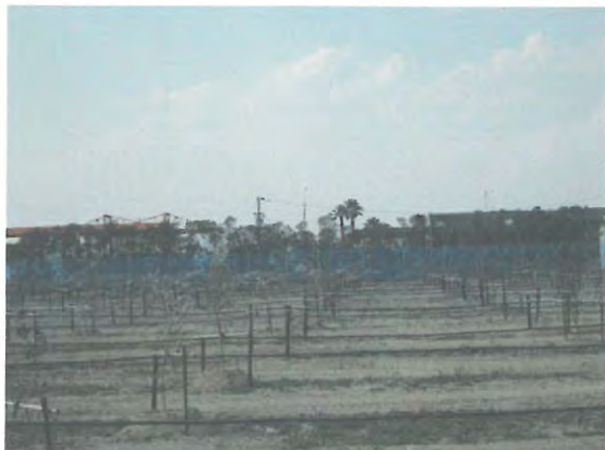
オリーブの植栽状況