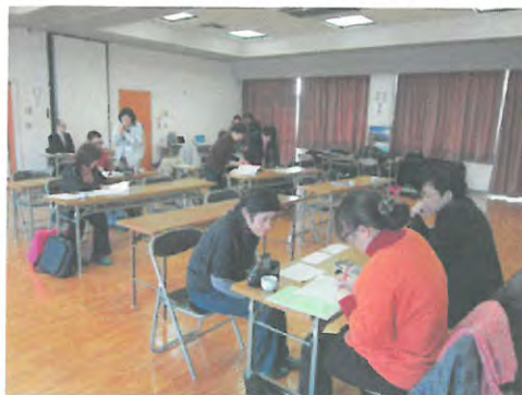
担い手に対する経営相談会