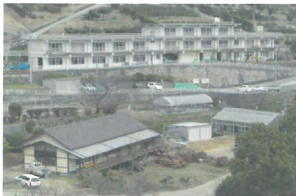
老朽化した府中果樹研究所及び小豆オリーブ研究所の施設整備(写真は府中果樹研究所)