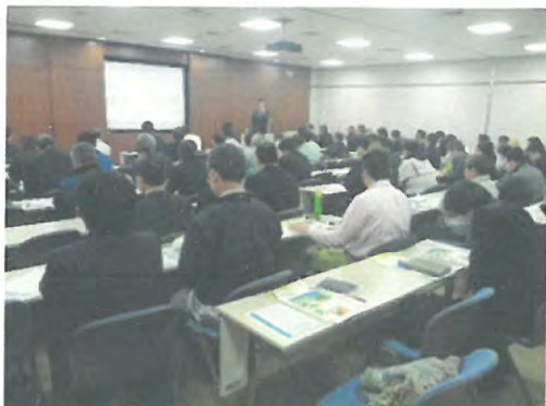
企業農業参入セミナー