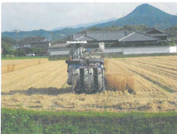
大区画化されたほ場での麦刈り