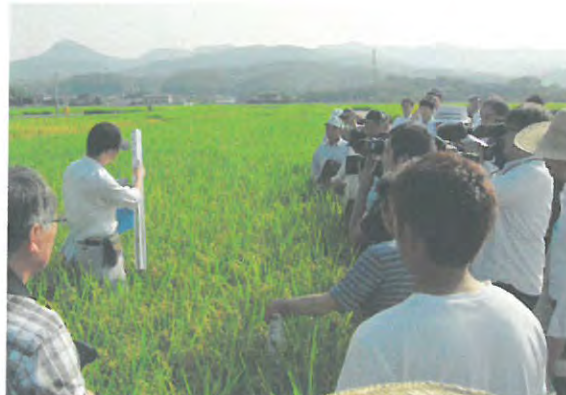
「おいでまい」マイスター研修会