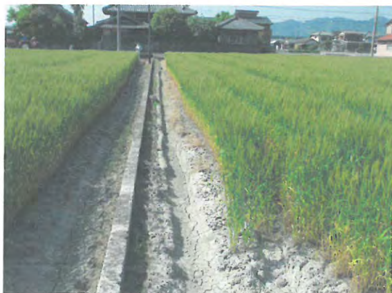
ほ場周囲に排水対策が徹底管理された様子