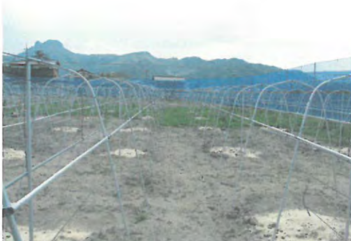
耕作放棄地の再生と施設整備