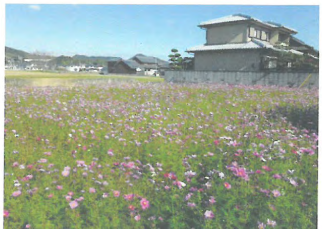
コスモスの植栽による農村景観の形成