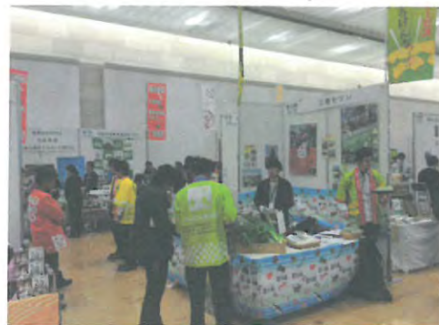
全国の見本市への出展支援(大阪)