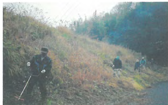
中山間地域における共同作業