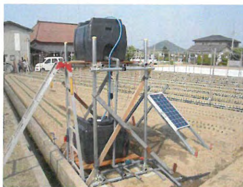
日射制御型拍動式自動灌水装置