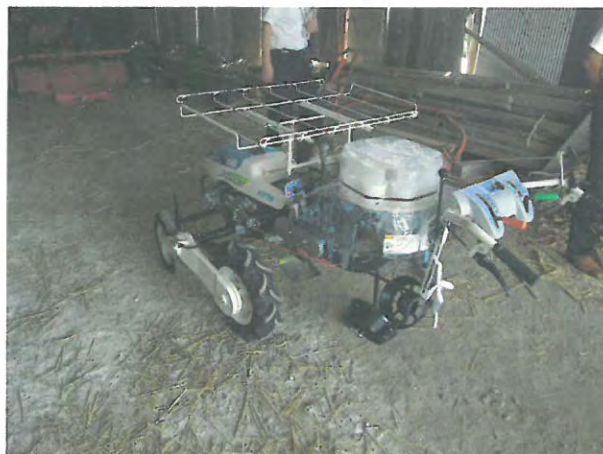
加工業務用キャベツの移植機