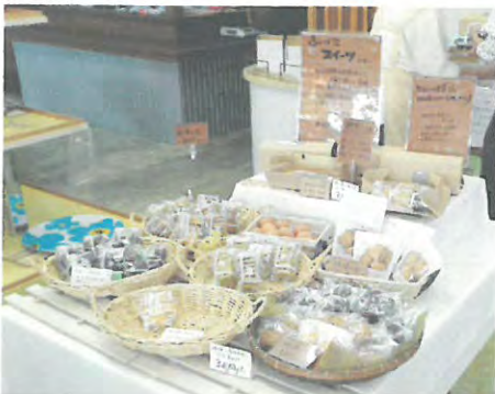
チャレンジコンペ採択プラン