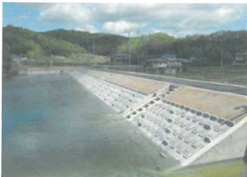
整備改修後のため池