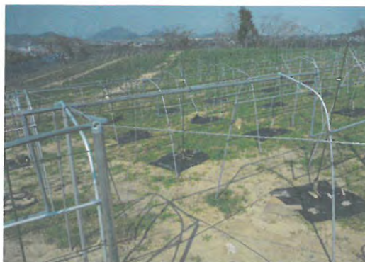
農業参入サポート支援事業で整備した果樹栽培施設