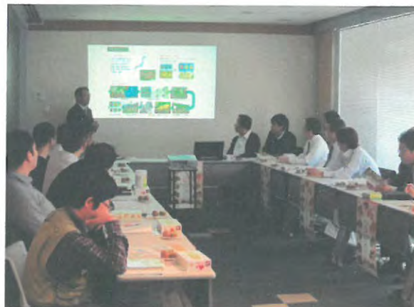
「さぬきキウイっこ」セミナー（東京都）