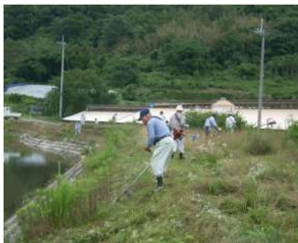
地域住民との協働によるため池の保安全管理