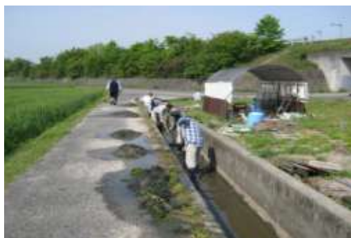
地域住民との協働による農業用水路の保全活動