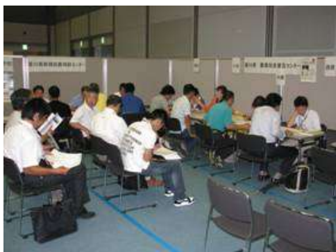
就農就業相談会の相談風景