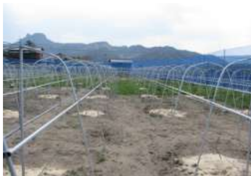
耕作放棄地の再生と施設整備