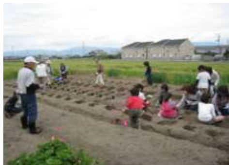
地域住民との協働による農村環境の保全活動