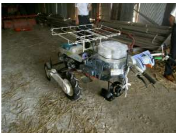
加工業務用キャベツの移植機