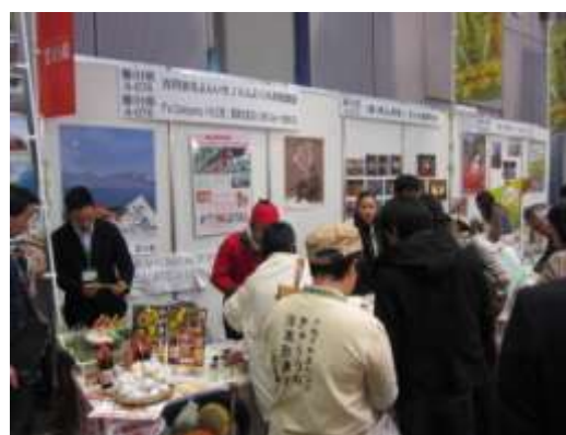
全国の見本市への出展(大阪)