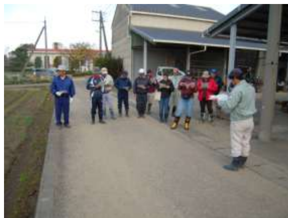
作業実施の打合せ