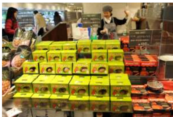
「さぬきキウイっこ」の販路開拓（伊勢丹新宿店ほか）