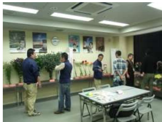
「なにわ花いちば」で香川県産花き展示会を実施