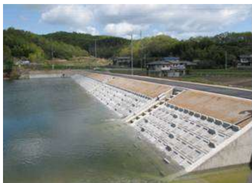
整備改修後のため池