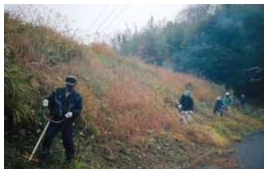
中山間地域における共同作業