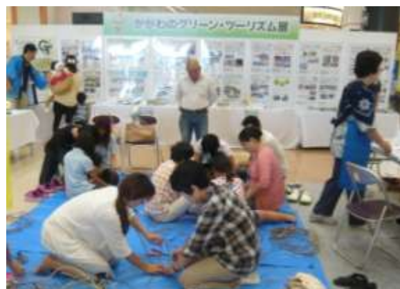
グリーン・ツーリズムフェア