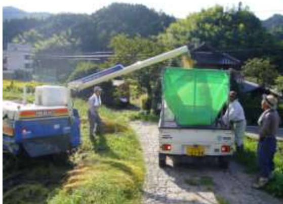
担い手による農作業支援