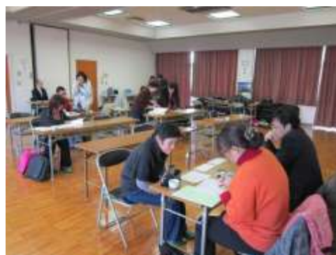
担い手に対する経営相談会