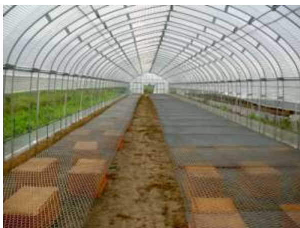
加工業務用キャベツの育苗施設