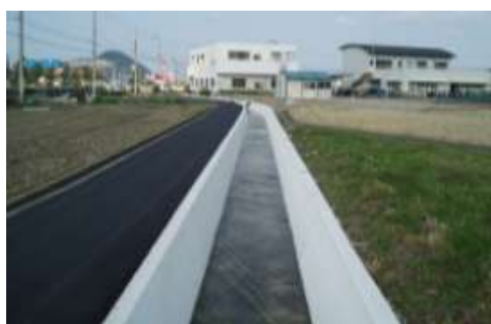
長寿命化対策後の農業用水路