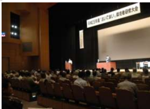
「おいでまい」栽培者研修大会