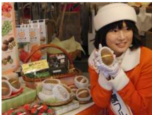
さぬき讚フルーツ大使による試食宣伝(県内百貨店)