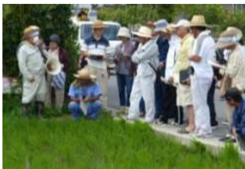
有機農業セミナー