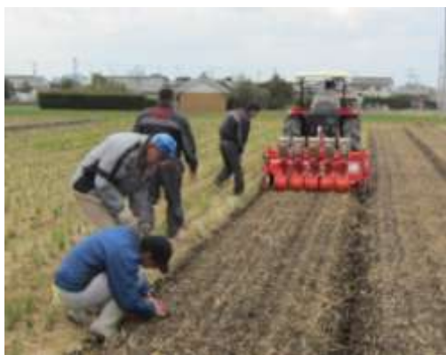
展示場における新技術(逆転ロータリ)実証風景