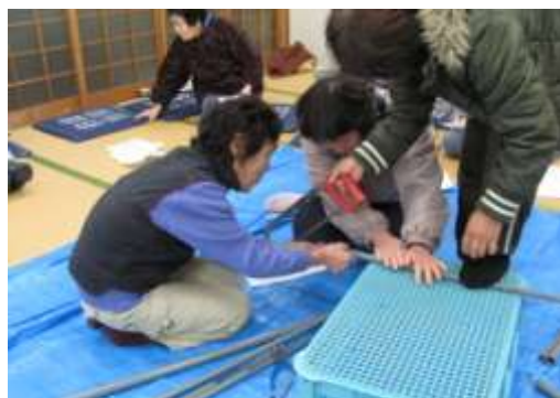
花火を使った追い払い道具の作成