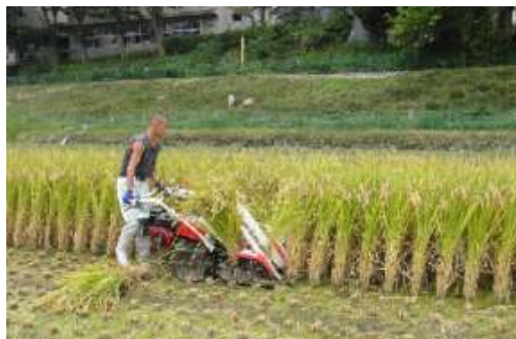
飼料用イネ専用品種”ホシアオバ”