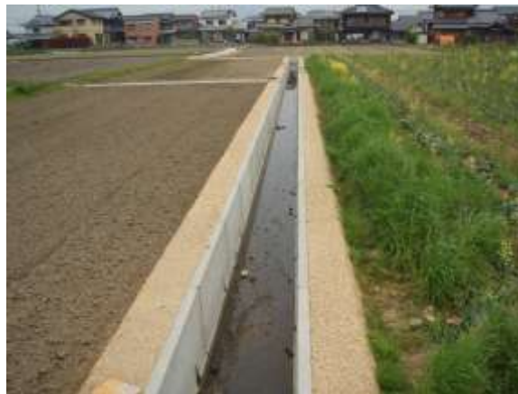
小規模な農業用水路の改修