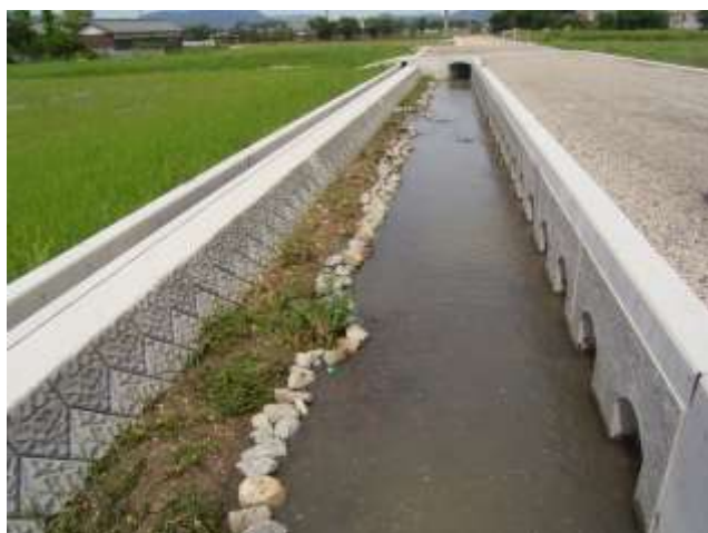
環境に配慮した水路