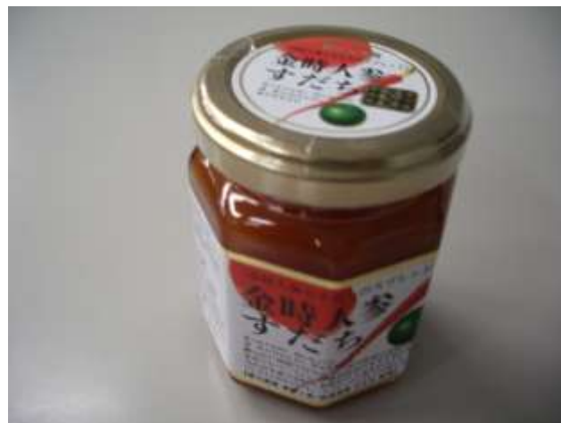
金時人参すだちスプレッド