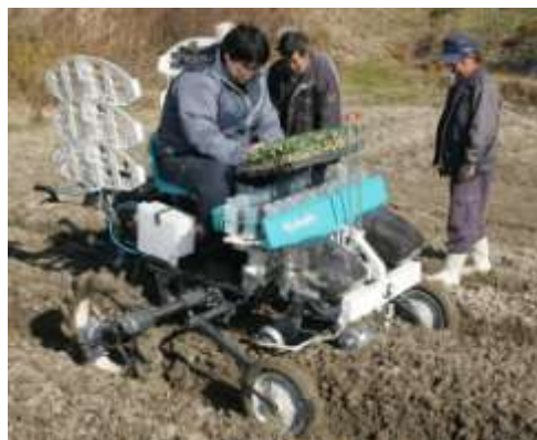
野菜導入による経営の複合化