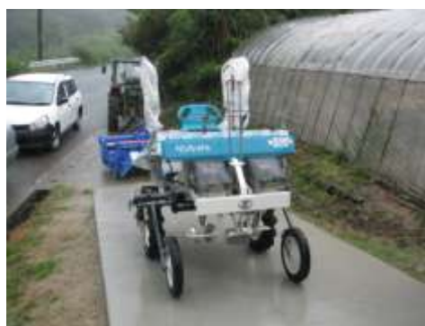
経営発展支援事業で整備された移植機