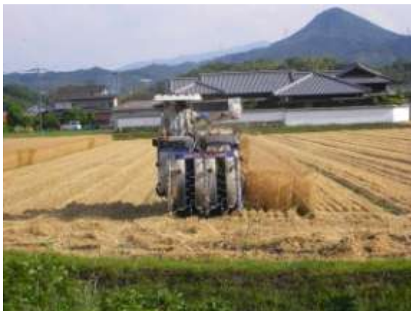
大区画化されたほ場での麦刈り