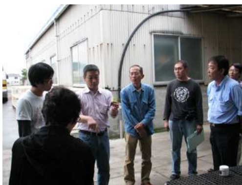
「のれん分け就農」に取り組む農業法人の視察