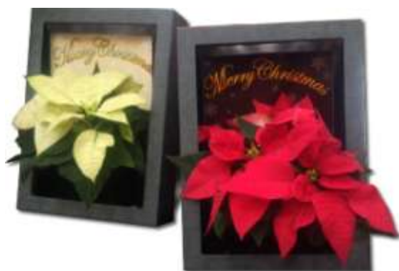
チャレンジコンペ採択プラン商品「育てる絵」