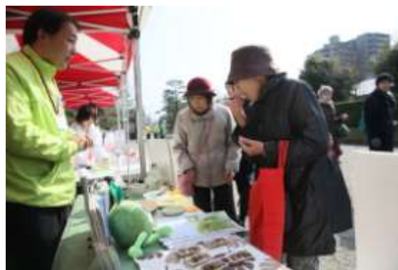
オリーブ広め隊によるPR