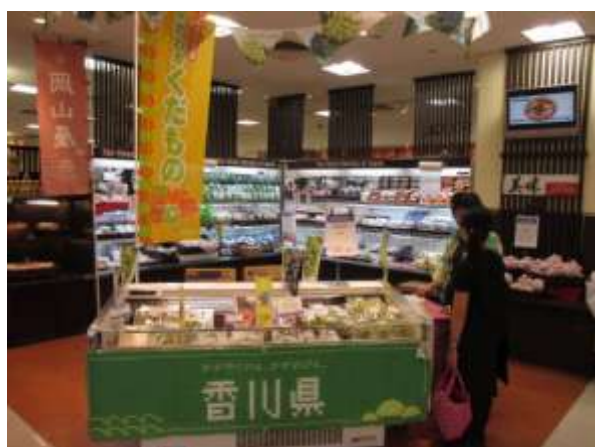
香川県フェアでの「シャインマスカット」販売 (シンガポール)