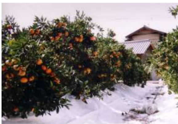
降雨や作型・園地条件に左右されない「小原紅早生」専用樹体管理技術の開発