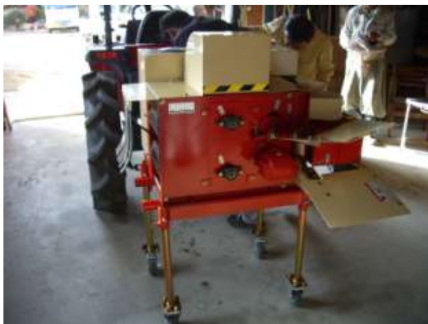
県農試開発のさとうきび脱葉機