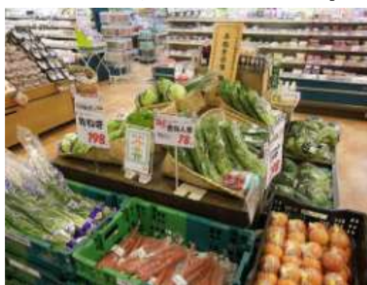
「かがわ地産地消協力店」での販売状況