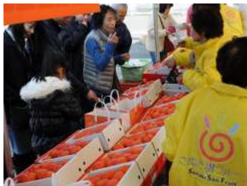
認定生産者が自前のオリジナルジャンパーで P R (坂出)