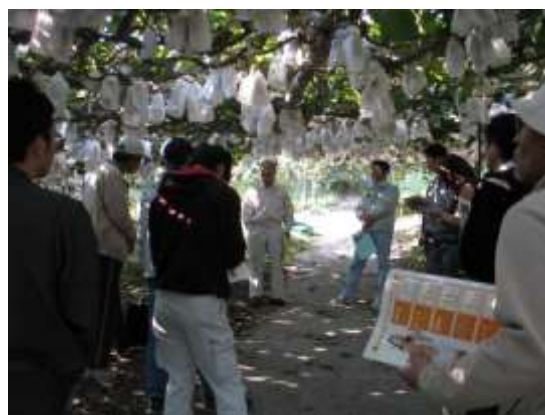
新品種による経営改善指導