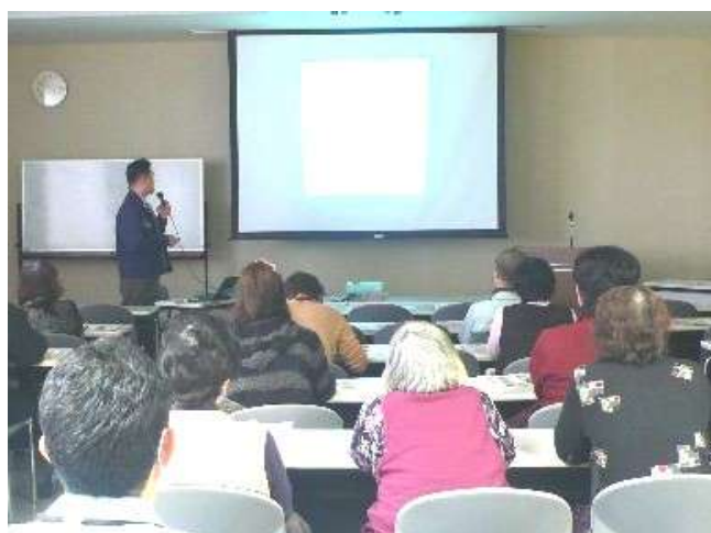
農業生産工程管理(GAP)講習会