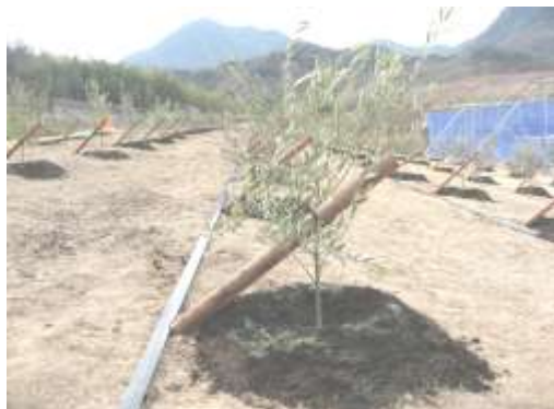
オリーブの植栽状況