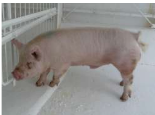
県外から導入した優良種雄豚