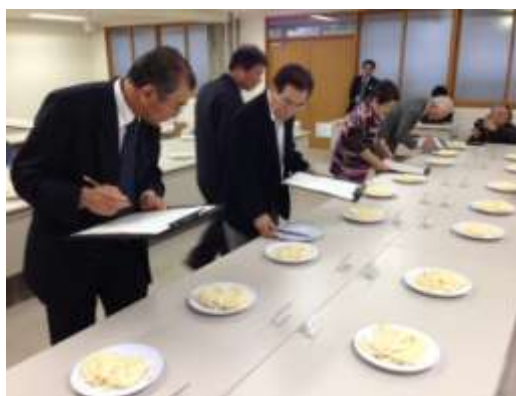
「さぬきの夢」うどん技能グランプリ審査風景