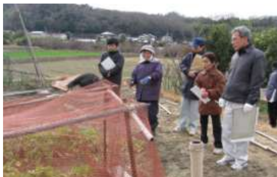
集落住民による環境点検整備