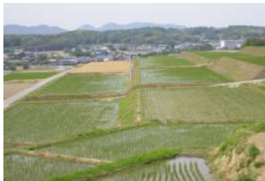
区画整理事業が完了した優良農地