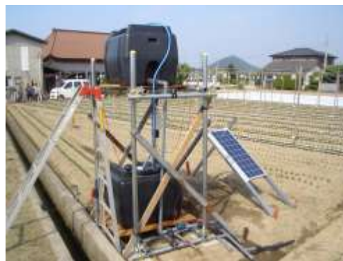
日射制御型拍動式自動灌水装置