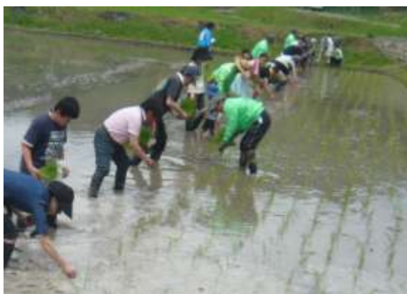
田植え体験ツアー