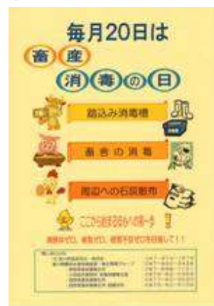
「畜産消毒の日」の農家周知用パンフレット