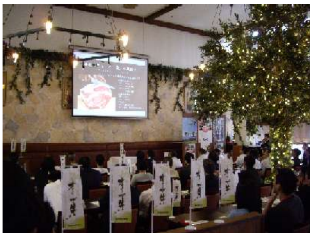
東京で開催した飲食店向け「オリーブ牛セミナー」