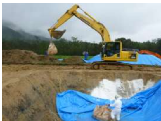
鳥インフルエンザ防疫演習(汚染物品等の埋却作業)