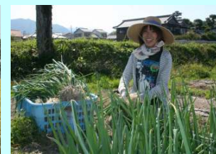
B 地区営農センター