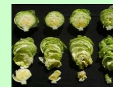
（加工業務に適したレタス品種検討）