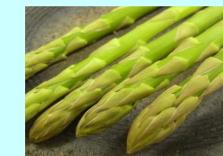
（穂先の締まった「さぬきのめざめ」）