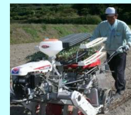
C 地区営農センター (農作業支援センター)