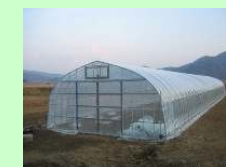
（施設・農地の流動化）