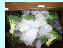
（鮮度の高い氷詰め出荷）