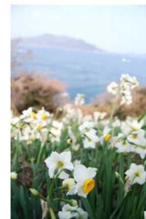
水仙は例年2月中旬が見頃

灯台の周辺は「男木水仙郷」。「男木水仙郷をつくる会」が2004年から植栽しており、約1万2000平方メートルに1100万株の水仙が咲き乱れる2月は、辺り一帯が甘い香りに包まれます。 ここからはしばらく水仙郷の案内板に導かれて山歩き。整備され歩きやすい道ですが、上り坂が続きます。この先にある「タンク岩」「ジイの穴」などの奇岩・奇景も男木の魅力の一つ。 家の間を縦横に走る路地は、いきなり坂道！ すぐに集落を抜け、山に沿って明るい道が続きます。左手には海が見え隠れ。途中、木の実を採っている地元の人に出会ってちよつと寄り道なども楽しみながら、灯台までは一本道、約30分の道のりです。 木々のトンネルを抜けると視界が一気に開けて、思わず歓声！ 対岸に見えるのは豊島でしょうか、行く手には灯台が頭をのぞかせています（上写真）。 高松から女木島を経由してフェリーで40分。男木島の港に近づくと、斜面に並ぶ家々がモザイクのように見えてきます。瀬戸内国際芸術祭の会場の一つであり、港のすぐそばには芸術祭をきっかけに再開した島の小学校も。にぎわいが戻りつつある島を今日はのんびり歩いて、まずは島のシンボル・男木島灯台を目指しましょう。