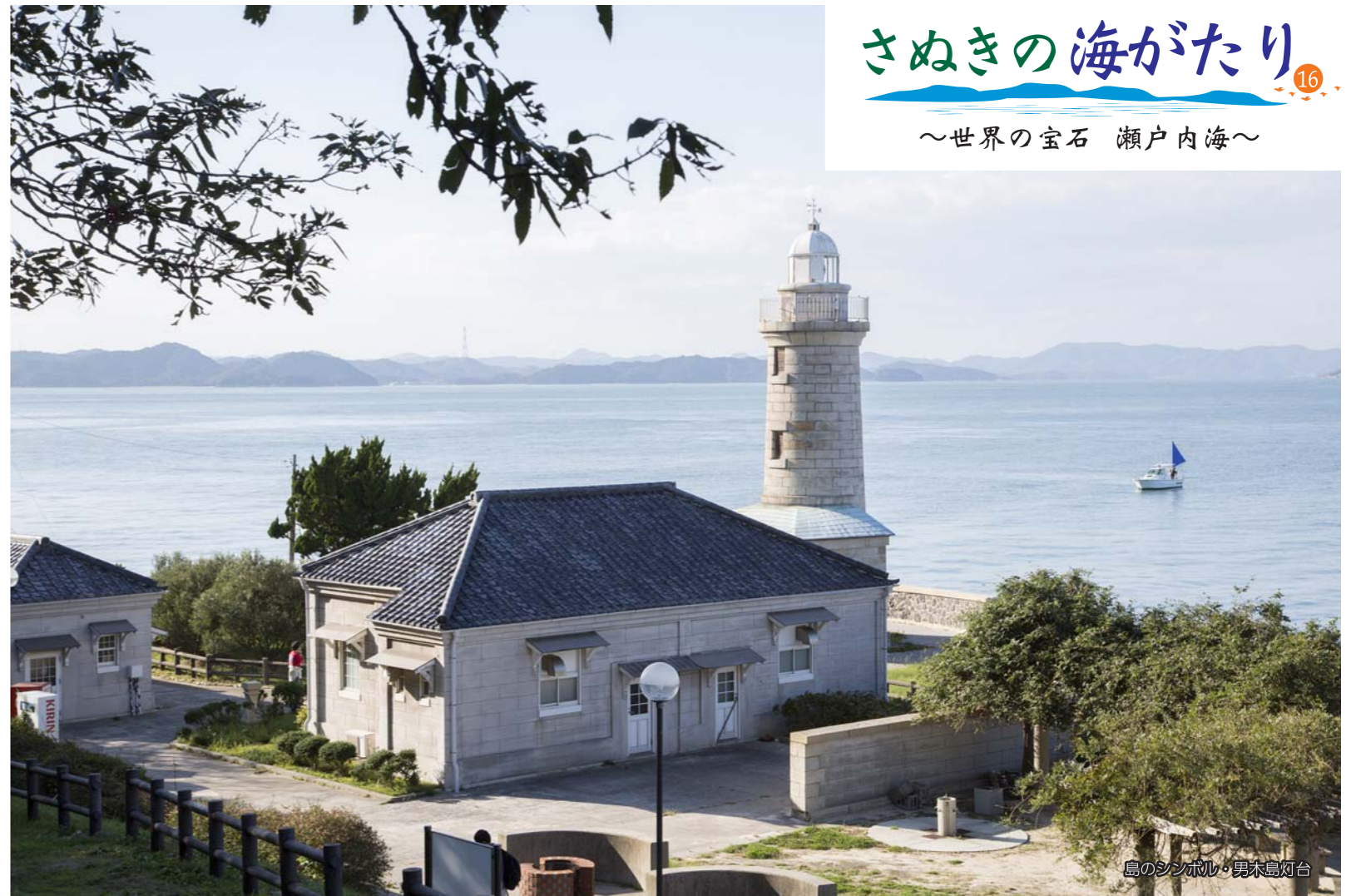
島のシンボル・男木島灯台