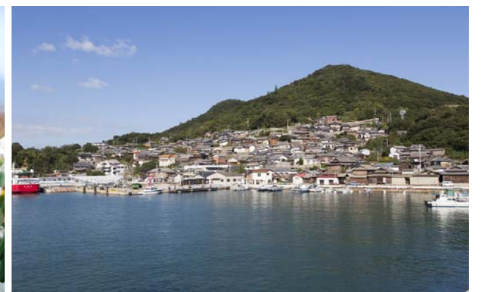
フェリーから島を望む

柱状節理が大きく突き出した「タンク岩」は高松市の天然記念物。ほとんどロッククライミングに近い格好で石だらけの斜面をタンク岩のところまで上ってみると、高低差のある眺めの向こうに海が広がり、なかなかの迫力。足腰に自信がある人にお勧めしたいスポットです。 ジイの穴付近から細くて急な山道を一気に下って、港と灯台を結ぶ道に戻ってきました。わずかな距離のはずなのに、なんだか大冒険をしたような気分。夕焼けに見送られて島を後にしながら、探検の余韻がいつまでも胸に残りました。