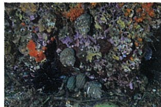
水中写真家 中村征夫氏が見たかがわの里海 (2015年2月撮影)