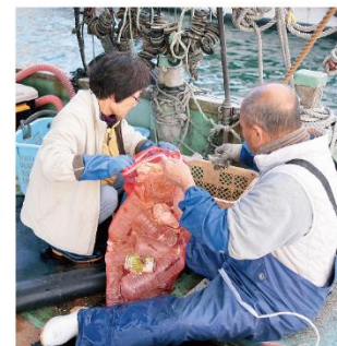
底びき網の中に魚といっしょにかかってしまう、海のごみ。5年ほど前から、瀬戸内漁協のほか県内で多くの漁協がこうして海のごみを回収する活動を行っている。

水産資源だけではなく、交通の面でも観光の面でも瀬戸内海はすばらしい海です。漁師としておいしくて、安全で、そして安く日常的に食べやすい魚を供給し続けていきたいと思っています。