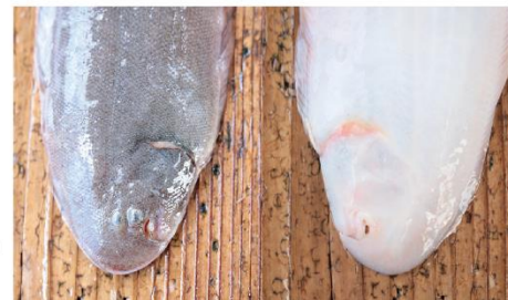
茶色い背のほうに小さな目がふたつ、目の横の小さなくぼみが口。裏側お腹のほうは真っ白で、先端の脇からも小さな口が見える。よく見ると不思議な顔。

シタビラメの呼び名は地域によって違いますが、私が知る限り、香川の漁師はみんな「ゲタ」ですね。履物のゲタに似ているから。牛の舌の形に似ているから「ウシノシタ」という呼び方もあります。種類でいえば、コウライアカシタビラメやアカシタビラメ、イヌノシタなどがあり、漁師は見れば種類の違いはわかっています。総じて「ゲタ」ですけどね。