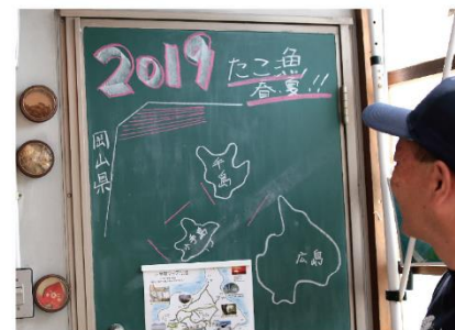
小手島は丸亀市の沖、ちょうど瀬戸内海上の岡山と香川の中間あたり。黒板の赤い線がタコつぼ縄を仕掛ける場所。

また、環境破壊から海を守りたいという思いから、タコつぼ縄にかかった海ごみは全部陸に持ち帰っています。ほとんどが缶や瓶、お菓子の袋などの“生活ごみ”。海から速く離れたところからでも風が吹けばごみは飛び、やがて川に運ばれて海に流れ込むわけです。つぼの中でタコがごみを抱えている姿を見たら、本当にやりきれない思いがします。海と陸はつながっているのです。陸のごみが海に入らないよう、一人ひとりが気にしてくれたら、海はもう少し豊かになるはずですよ。