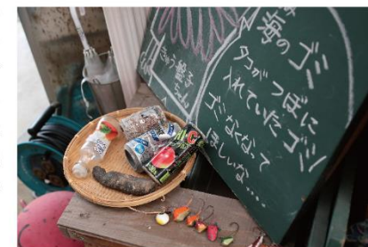
つぼや縄にかかった海ごみの一例。訪れる人に見てもらい、理解を求める活動もしている。