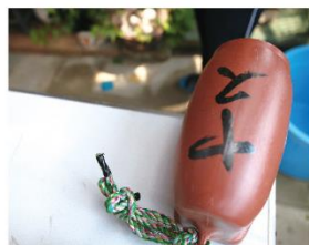
タコつぼ。かつては素焼のつぼだったが最近では扱いやすいプラスチック製が主流。底にコンクリートを流し固めてあり1つ2~3キロの重量がある。

底びき網漁もありますが、うちは「タコつぼ縄漁」専門です。1つ2~3キロのタコつぼを、約8メートルおきに1本のロープに160~180個ほど結びつけた「タコつぼ縄」を、タコがいそうな海底に仕掛けます。2~3日後、タコつぼの中にタコが入った頃、巻き上げ機で船上に引き上げ、つぼの中のタコを1匹ずつ捕まえるという漁です。全部のつぼにタコが入ることはなく、例えばタコつぼ縄7本、つまりタコつぼ1200~1300個を引き上げても、獲れるタコはせいぜい30~40匹。そのくらいのヒット率なんです。