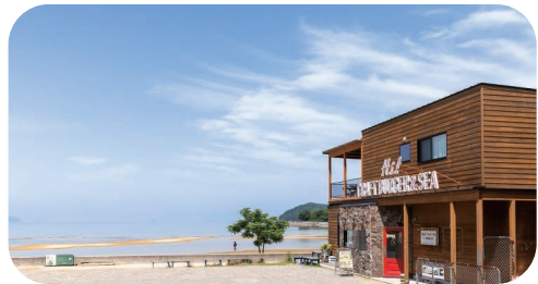
【撮影協力】 BAKE STUDIO OKAZAKI 香川県三豊市仁尾町仁尾乙274-9