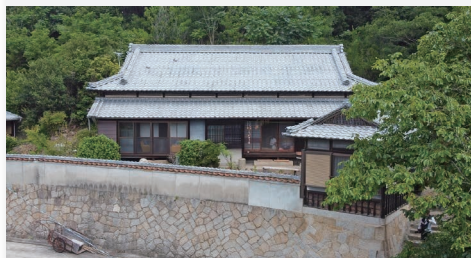
島旅農園「ほとり」 香川県丸亀市広島町江の浦247 TEL 070-8409-5969