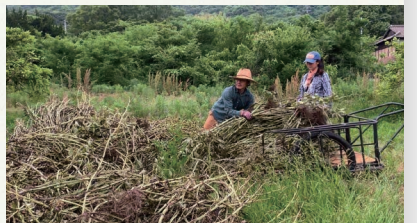
ソラマメや香川本鷹の、収穫後の木も焼いて釉薬にする。

島で栽培されるソラマメやミカンの皮、空き地に伸びる草を焼いた灰から作る。材料全てを手島内で調達している。