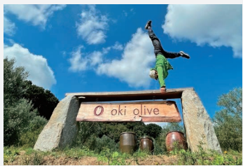
奥オリーブ 香川県高松市西植田町4532 TEL 080-1623-7772