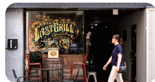
【撮影協力】 LAST GRILL 香川県高松市瓦町2-9-4