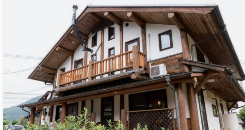
癒やしの郷 神うち 香川県坂出市王越町木沢499-1 TEL 080-2982-7114