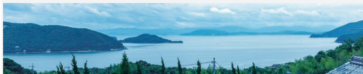
タネむすび荘 香川県小豆郡小豆島町西村甲1192 TEL 090-8746-5069