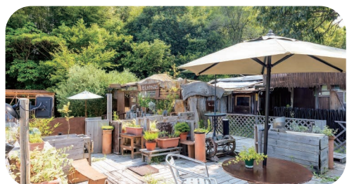
【撮影協力】 憩家たけかんむり 香川県綾歌郡綾川町陶7019-1