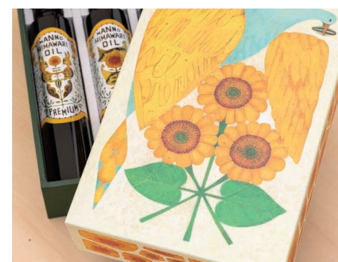
有名イラストレーター福田利之氏が手掛けたパッケージも好評。

梅雨が明け本格的な夏が訪れる頃、まんのう町帆山区に「黄色い魔法」がかかる。畑一面のヒマワリの花が訪れる人にも、にぎわいが戻ったまちの人にも笑顔を咲かせるのだ。その種からこだわりの製法で作られたオイルは、栄養価が高く、ブランドオイルとして全国から注目を集めている。まんのう町のヒマワリは、花もオイルもビタミンカラーで元気を届けてくれる。